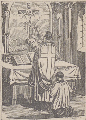
Kapłan podnosi Hostyę św.