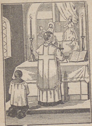
Kaptan odmawia Introit.