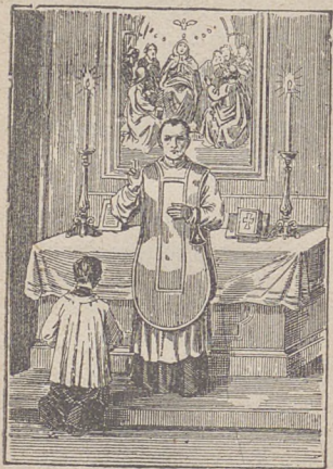
Kapłan udziela błogosławieństwa.