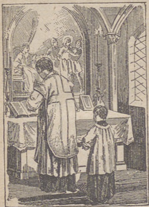
Kapłan czyta Ewangelię