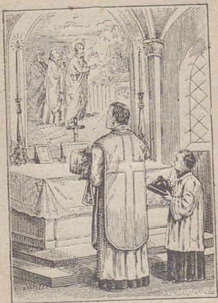
Kapłan zbliża się do ołtarza.