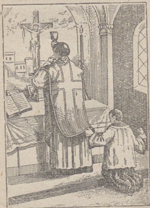
Kapłan podnosi klelch.