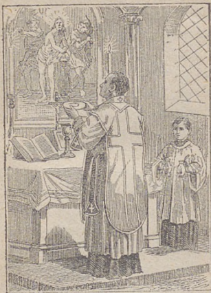
Kaplan ofiaruje chleb i wino.