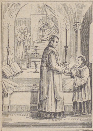
Каптан умыва рѣце.