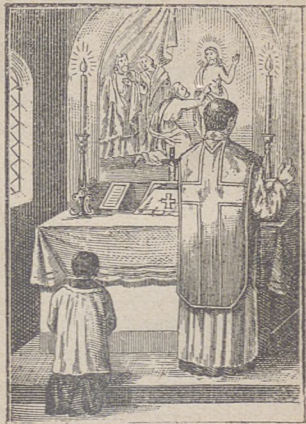
Kapłan odmawia ostatnie modlitwy