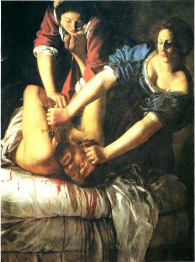
Artemisia Gentileschi – „Judyta i Holofernes”