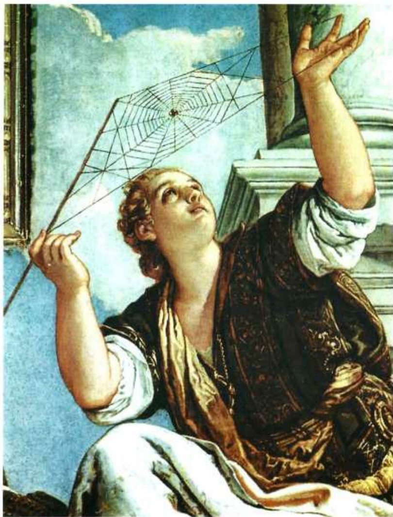
Paolo Veronese – „Dialektyka”