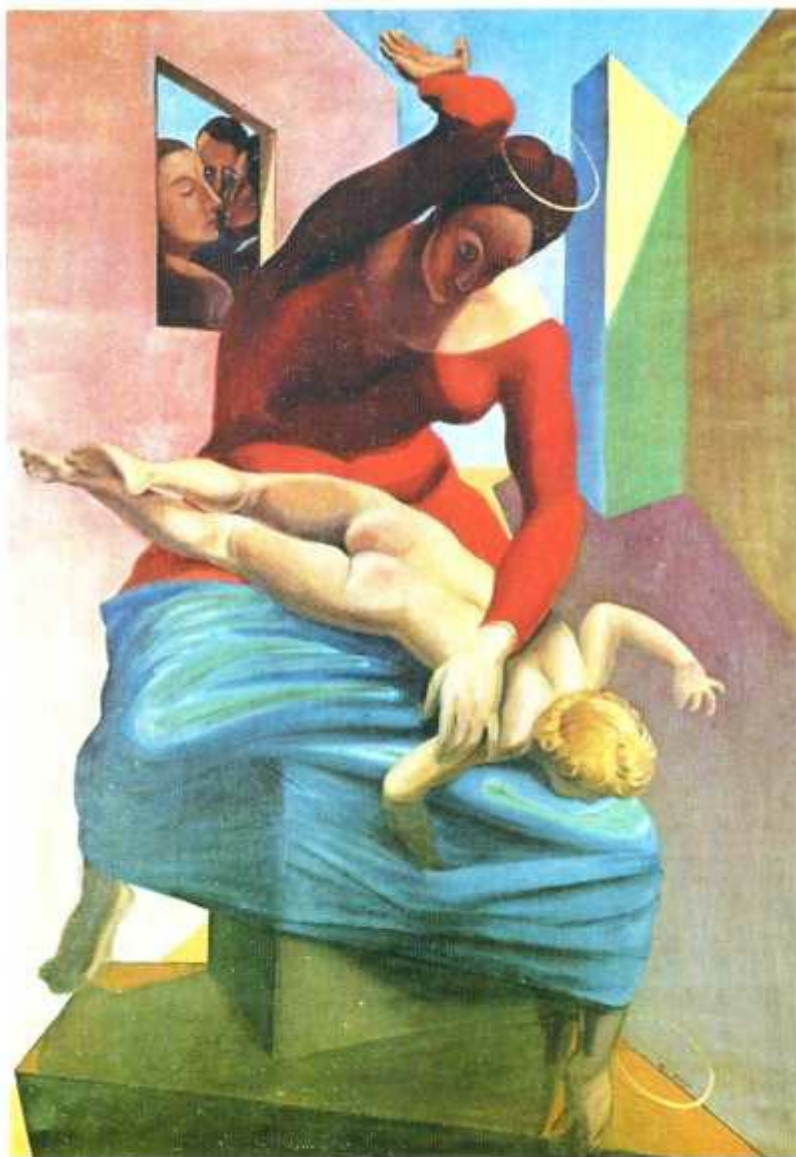
Max Ernst – „NMPanna karząca Jezusa”