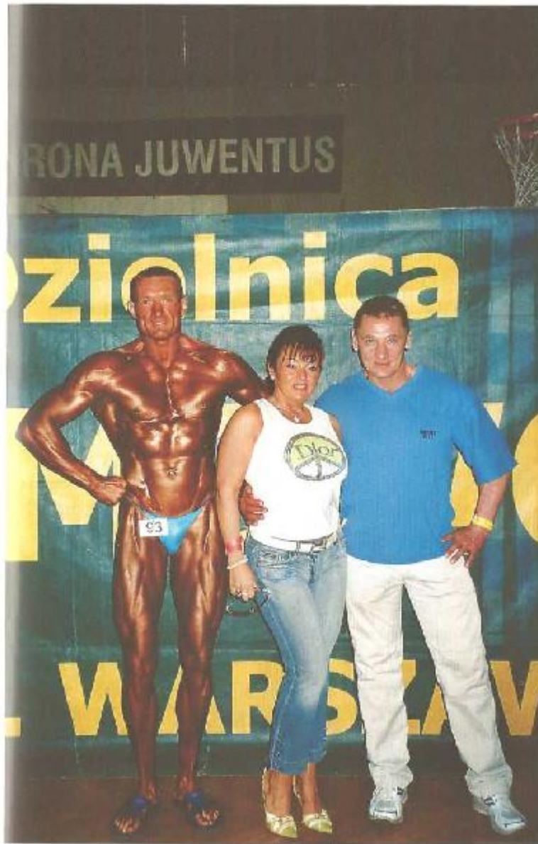
Monika z kulturystami