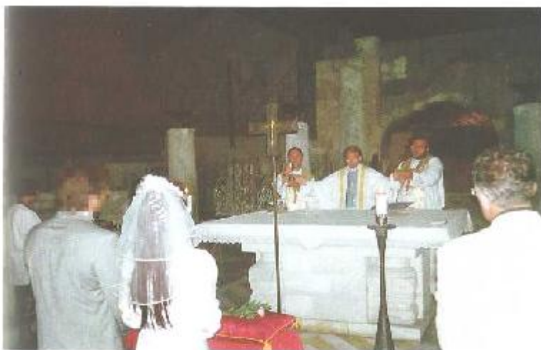
Ślub w Bazylice Zwiastowania Pańskiego w Nazarecie