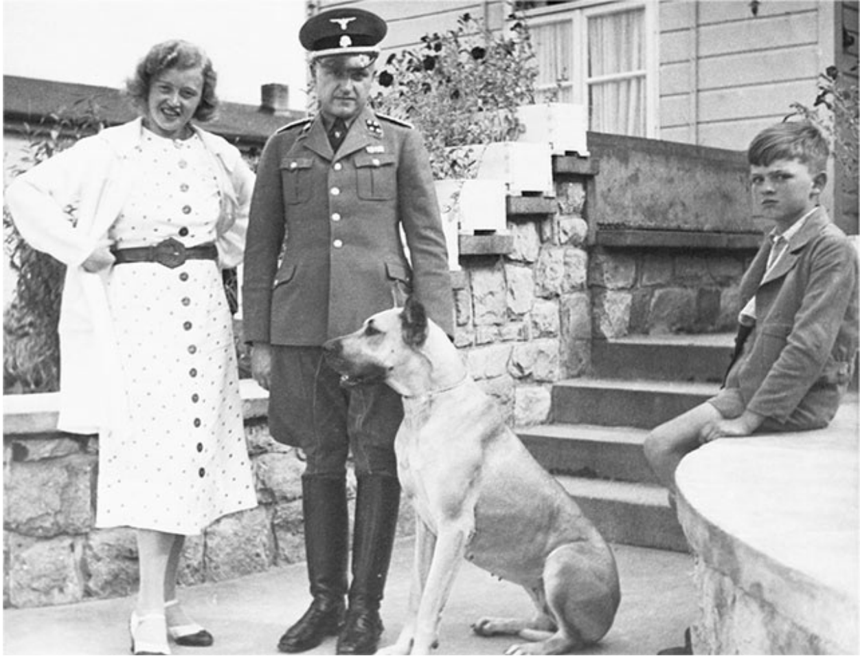
Ilse Koch, zwana „Suką z Buchenwaldu”, pozuje do zdjęcia w towarzystwie męża, pułkownika SS Karla Kocha, oraz syna i psa. Jako nadzorkzyni obozu koncentracyjnego w Buchenwaldzie Koch słynęła z okrucieństwa i sadystycznych skłonności – chodziły nawet plotki, że kolekcjonowała abażury do lamp oraz rękawiczki zrobione z wytatuowanej skóry zabitych więźniów.