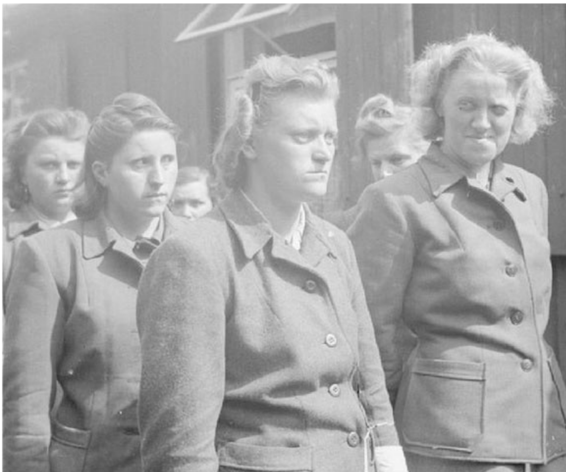
Należącym do SS strażniczkom rozkazano pogrzebać zmarłych. Wśród nich dojrzeć można główną nadzorczynię Elisabeth Volkenrath (po prawej stronie, częściowo zasłonięta) oraz Hertę Bothe (z przodu, po lewej).