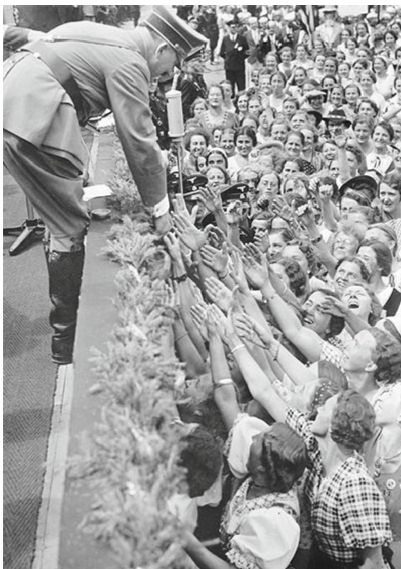
Setki młodych kobiet przewracają barierki, by przywitać się z Hitlerem w lipcu 1935 roku podczas Niemieckiego Festiwalu Sportowego.