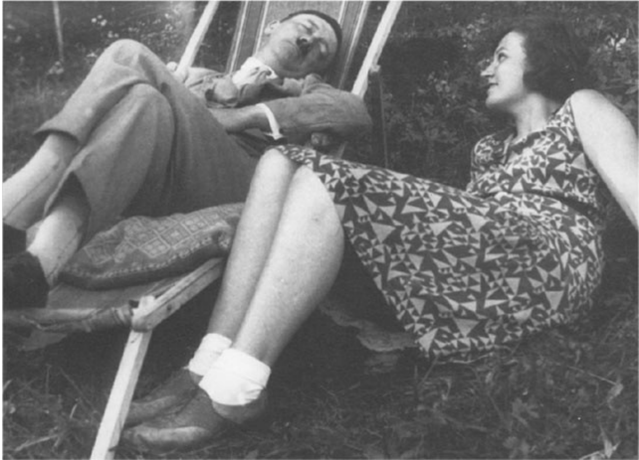
Hitler odpoczywa na leżaku w towarzystwie swej siostrzenicy, Angeli „Geli” Raubal, około 1930 roku. We wrześniu 1931 roku w monachijskim mieszkaniu Geli znaleziono jej zwłoki z płucem przestrelonym z rewolweru Hitlera.