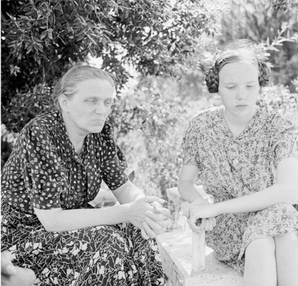
Margarete i Gudrun Himmler, żonę i córkę dowódcy SS Heinricha Himmlera, sfotografowano w alianckim obozie dla internowanych pod Rzymem, w lipcu 1945 roku. Gudrun (ur. 1929) po dziś dzień aktywnie wspiera ruch neonazistowski.