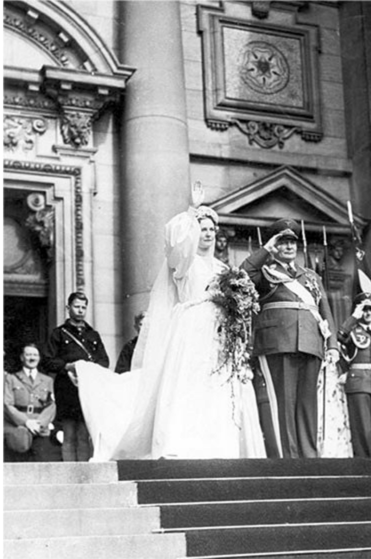
Przed wyjściem za mąż za dowódcę Luftwaffe, Hermanna Göringa, Emmy Göring pracowała jako aktorka teatralna. Na zdjęciu widać, jak nowożeńcy wychodzą z berlińskiej katedry w dzień ślubu. Za nimi, w drzwiach, stoi Hitler.