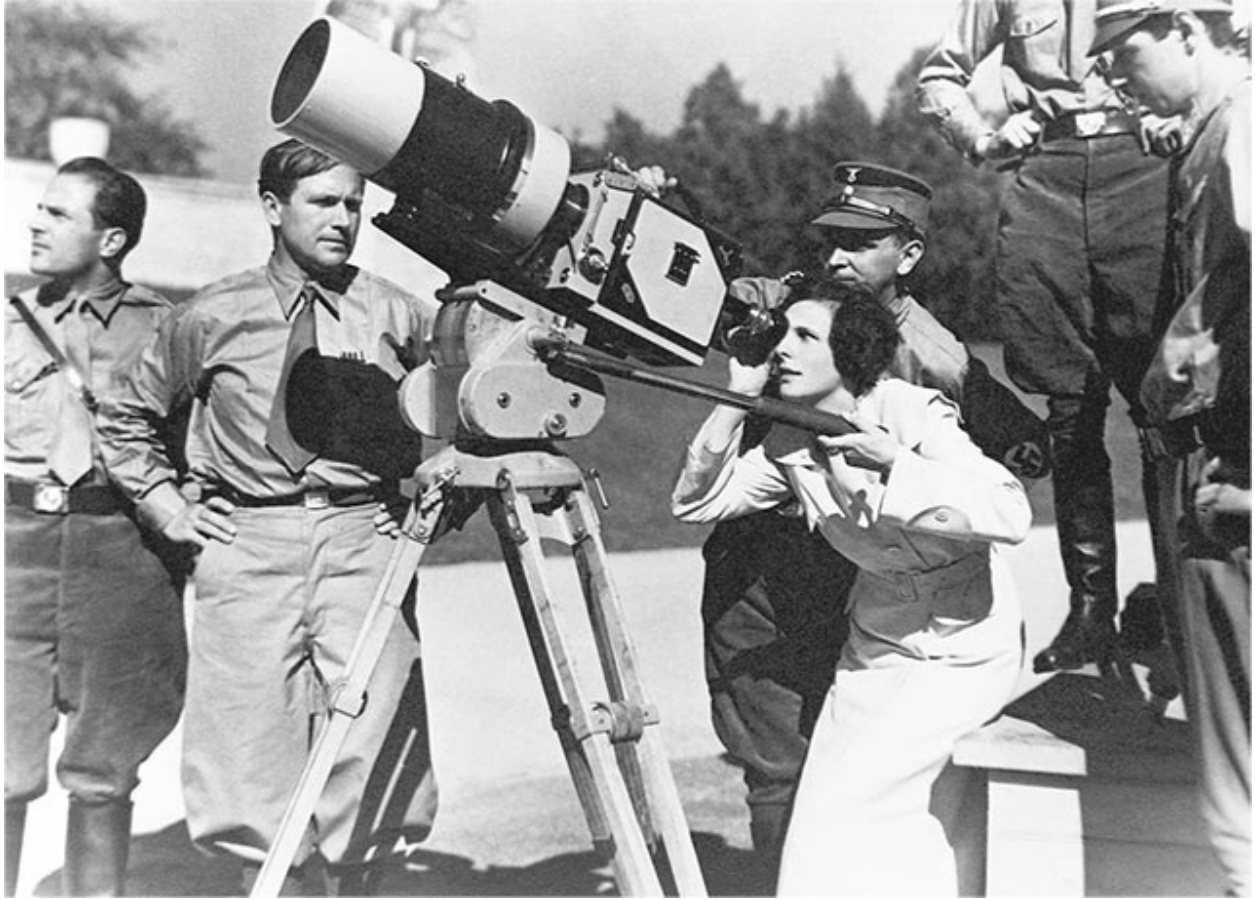
Reżyserka Leni Riefenstahl kręci Triumph des Willens ( Triumf woli ) na norymberskiej ulicy podczas zjazdu partii nazistowskiej w 1934 roku.