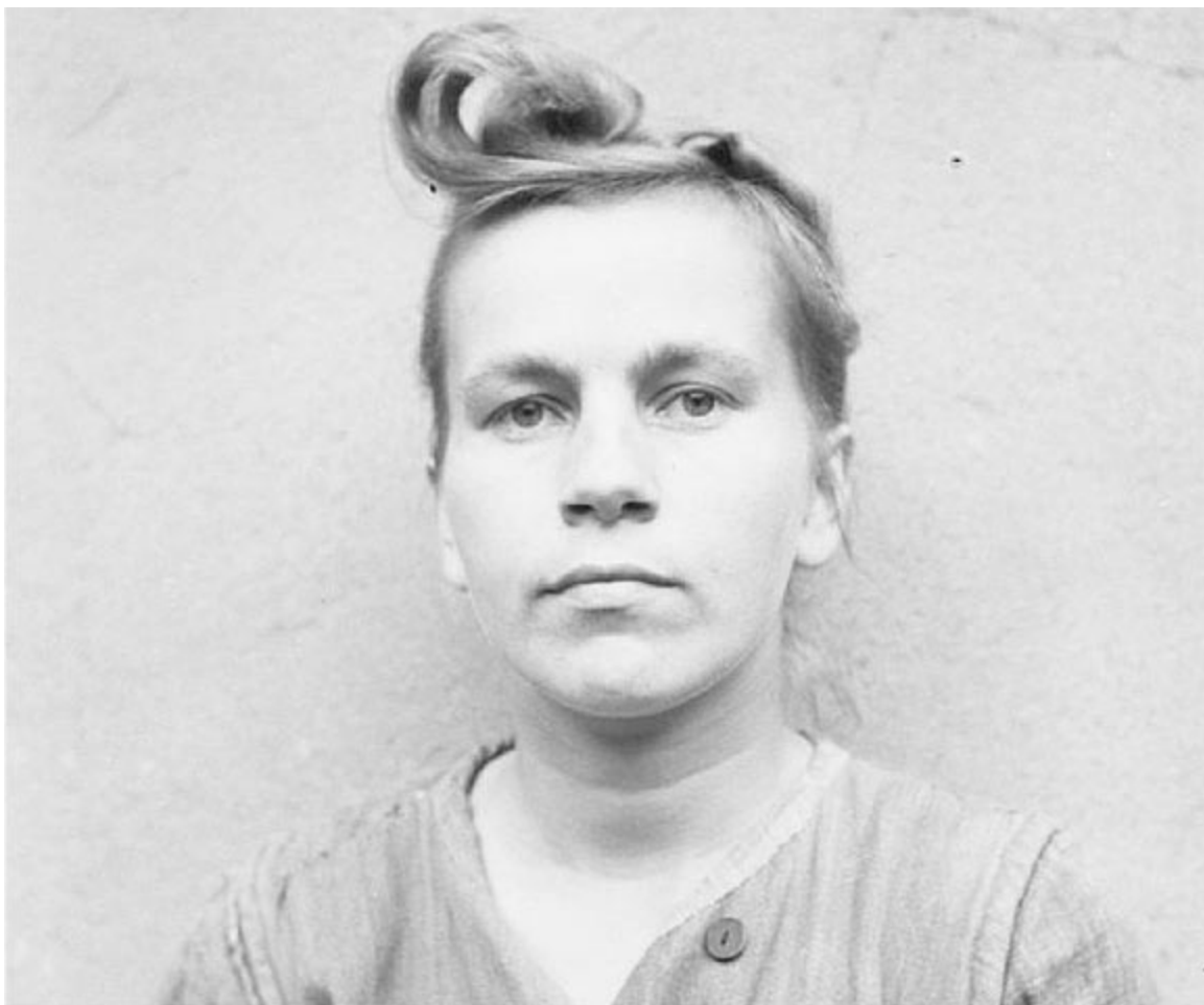
Elisabeth Volkenrath. Skazana na śmierć, egzekucję wykonano 13 grudnia 1945 roku