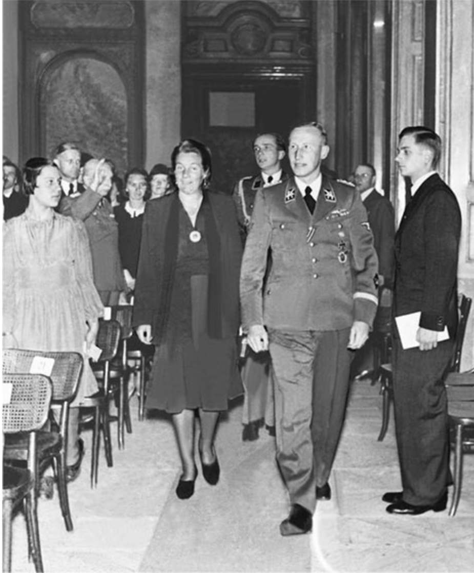
Lina Heydrich przyszła posłuchać koncertu w praskim pałacu Wallensteina wraz z mężem, Reinhardem, w maju 1942 roku. Lina była żarliwą członkinią partii nazistowskiej i to ona namówiła męża na pracę w SS. Reinhard został zamordowany miesiąc po zrobieniu tego zdjęcia.