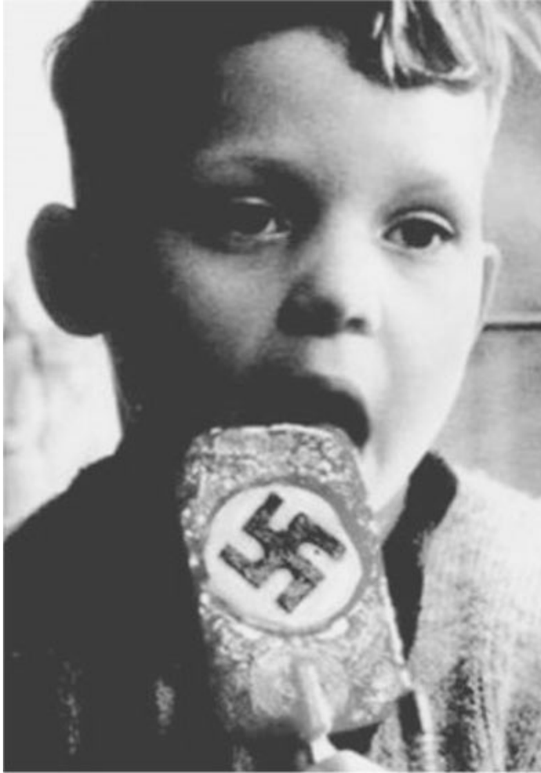
Chłopiec zjadający nazistowskiego lizaka.