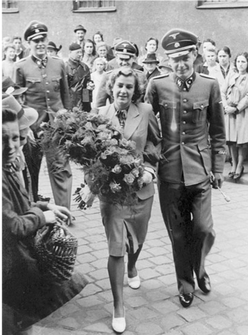
Na zdjęciu widać Gertraud „Traudl” Junge, najmłodszą z sekretarek Hitlera, w dniu jej ślubu z Hansem Junge w 1942 roku. Junge towarzyszyła Hitlerowi w bunkrze w 1945 roku, a półtora dnia przed jego samobójstwem spisała na maszynie podyktowany przez niego testament.