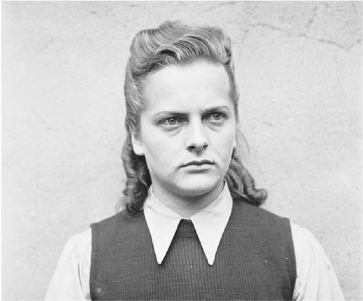
Irma Grese. Skazana na śmierć, egzekucję wykonano 13 grudnia 1945 roku