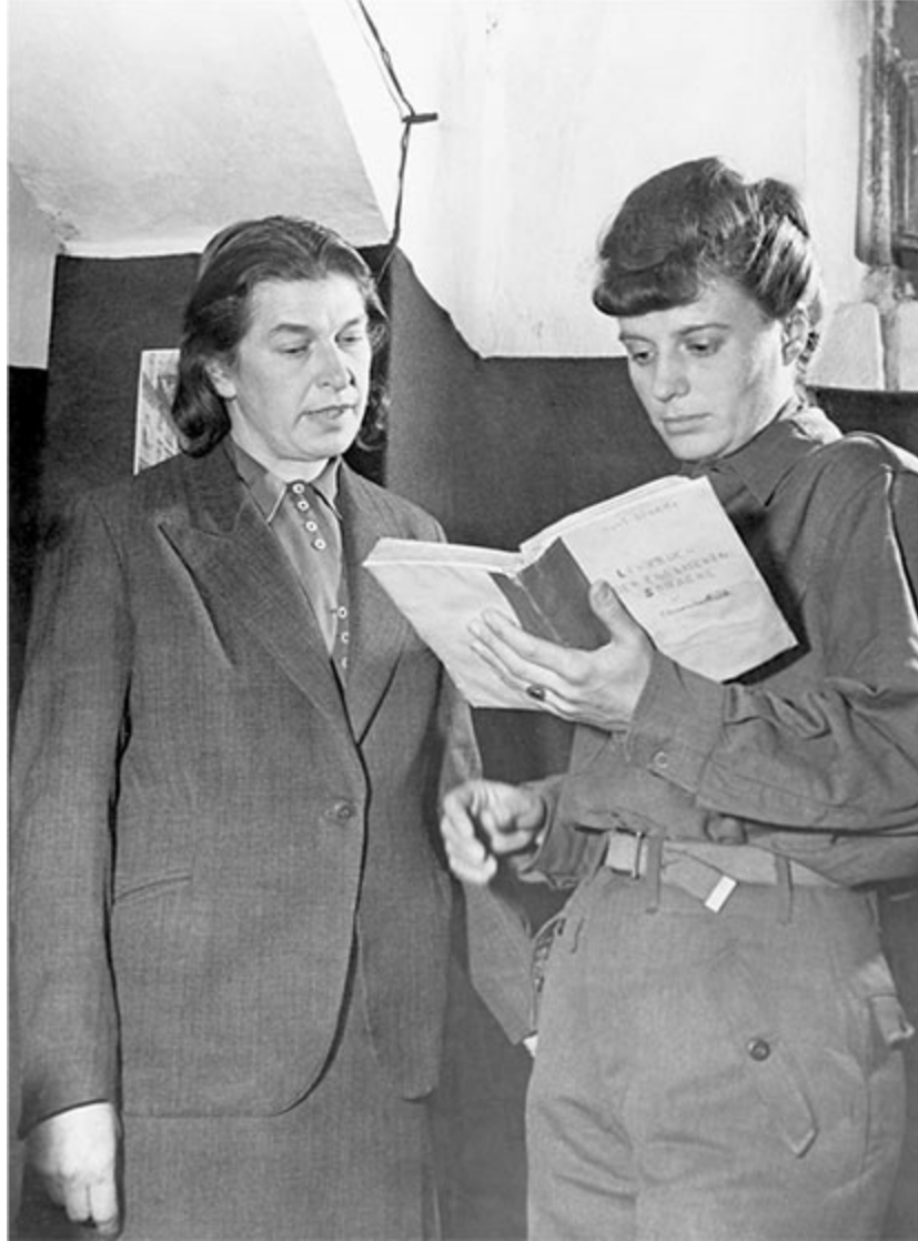
Johanna Wolf (po lewej) pracowała jako osobista sekretarka Hitlera. Była zagorzałą nazistką, lecz – w przeciwieństwie do Traudl Junge – nie zgodziła się na przeprowadzenie z nią wywiadu po śmierci Hitlera.