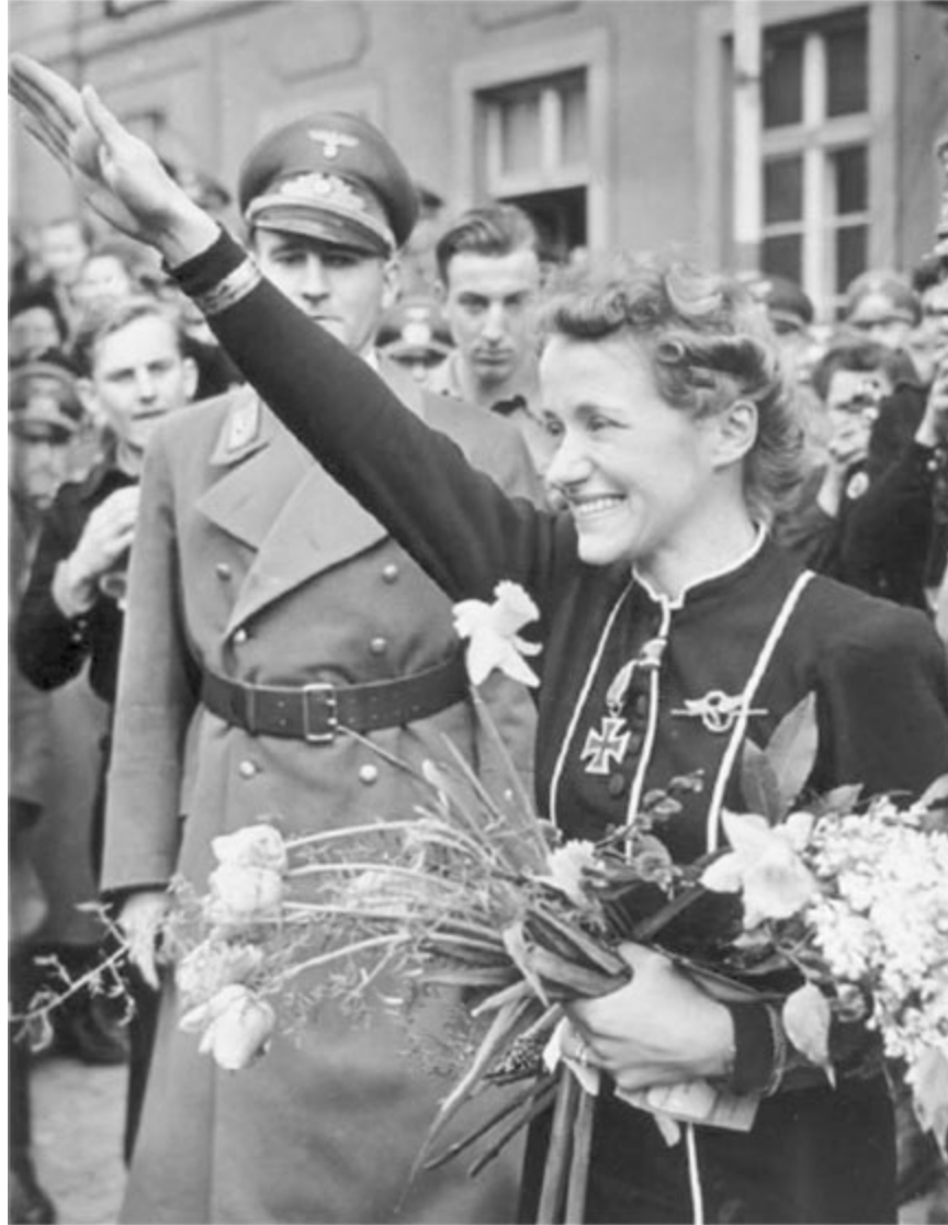
Lotniczka Hanna Reitsch powraca do rodzinnego Hirschbergu odznaczona Żelaznym Krzyżem i wita się ze swymi sympatykami nazistowskim salutem, około kwietnia 1941 roku.