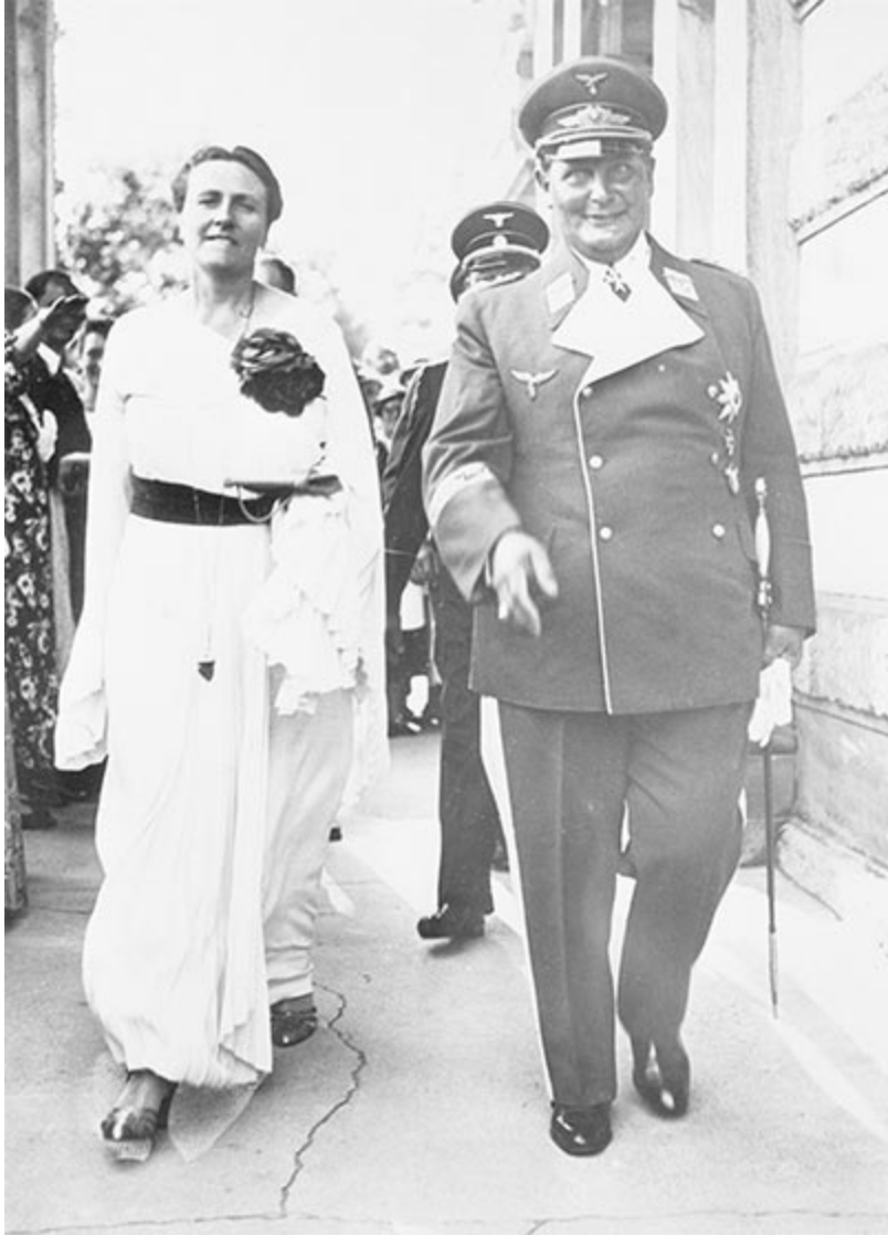
Winifred Wagner, synowa dziewiętnastowiecznego kompozytora, przybywa na festiwal w Bayreuth w towarzystwie Hermanna Göringa. Winifred organizowała coroczny hołd dla twórczości Richarda Wagnera od 1930 roku aż do końca drugiej wojny światowej.