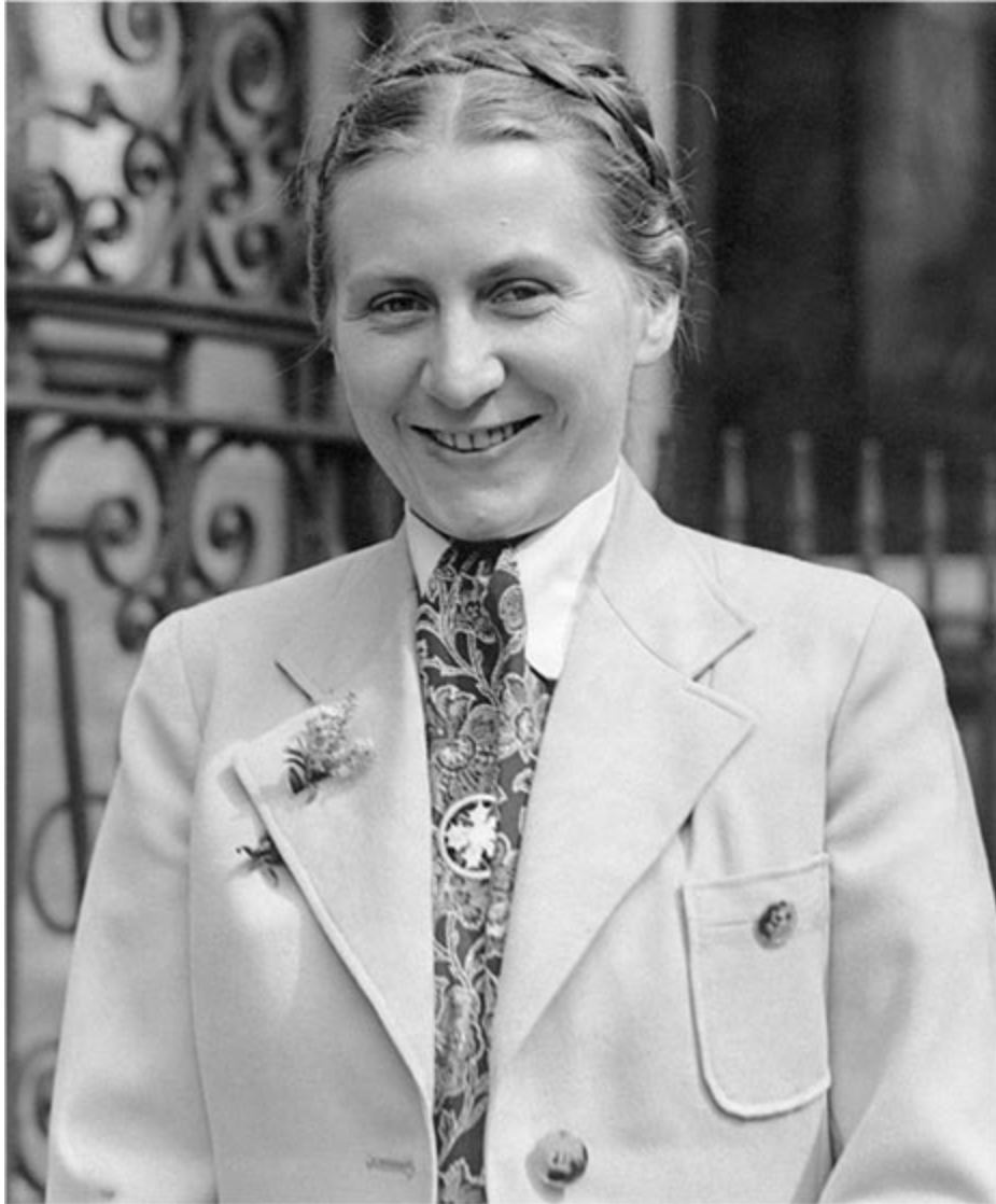
Gertrud Scholtz-Klink, przywódczyni Narodowosocjalistycznej Organizacji Kobiet, sfotografowana podczas wizyty w Londynie w 1936 roku. W 1978 roku Scholtz-Klink wydała książkę zatytułowaną Die Frau im Dritten Reich (Kobieta w Trzeciej Rzeszy), w której dała wyraz swemu niesłabnącemu poparciu dla narodowego socjalizmu.