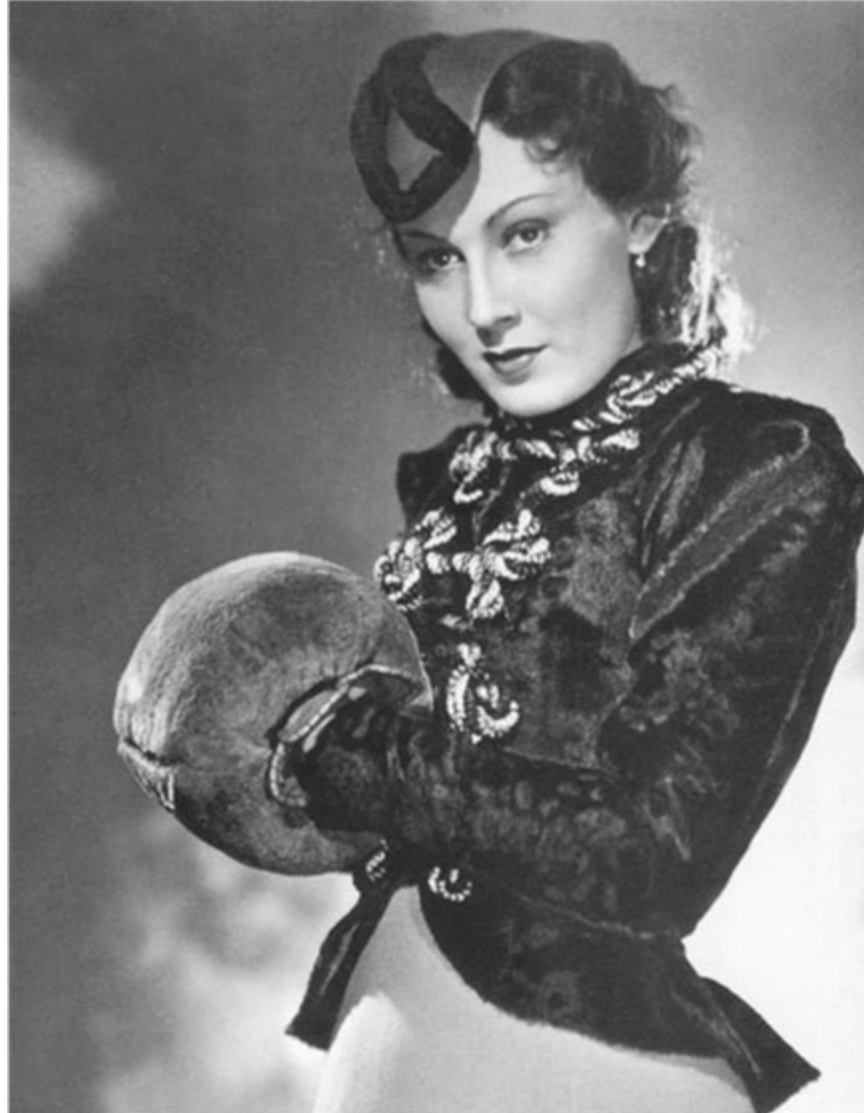
Czeska aktorka Lída Baarová w osadzonym w czasach pierwszej wojny filmie Patrioten ( Patrioci ) z 1937 roku. W momencie gdy robiono to zdjęcie, jej romans z Goebbelsem trwał już od roku.