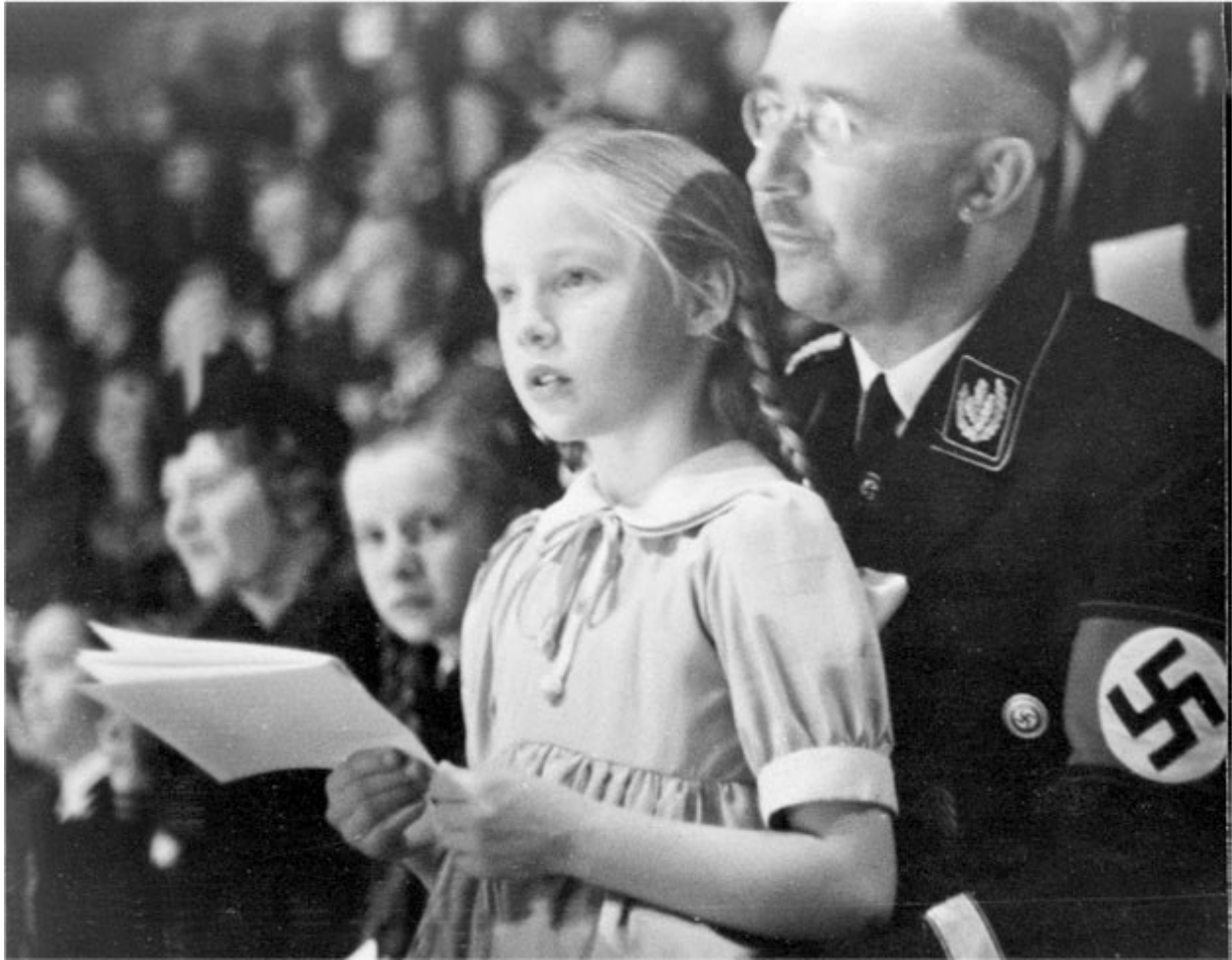
Gudrun Himmler często towarzyszyła ojcu podczas pełnienia przez niego oficjalnych obowiązków. Tu, na przykład, obecna jest na zawodach sportowych w marcu 1938 roku.