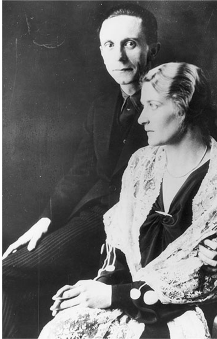
Joseph oraz Magda Goebbelsowie na zdjęciu z 1939 roku. Magda uosabiała ideał aryjskiej urody, a w nazistowskich materiałach propagandowych opisywana była jako doskonała matka i wzorowa pani domu.