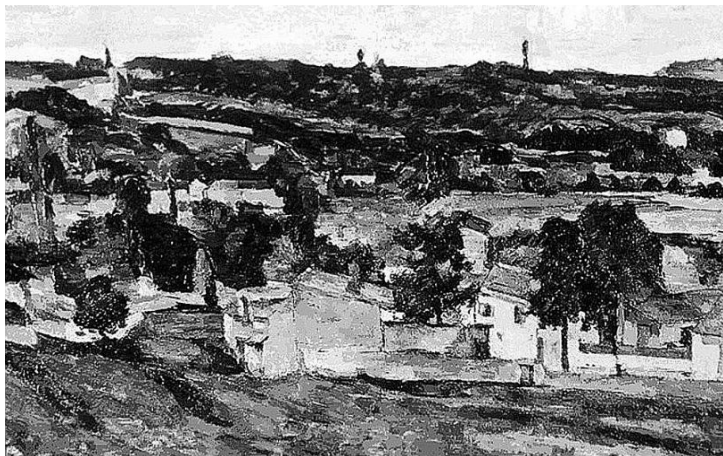
1. "Widok Auvers-sur-Oise", Paul Cezanne. Obraz ukradziony z Ashmolean Museum w Oksfordzie w 2000 roku.