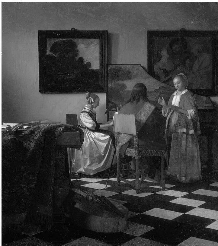
4. „Koncert”, Jan Vermeer. Obraz skradziony z Isabella Stewart Gardner Museum w 1990 roku.