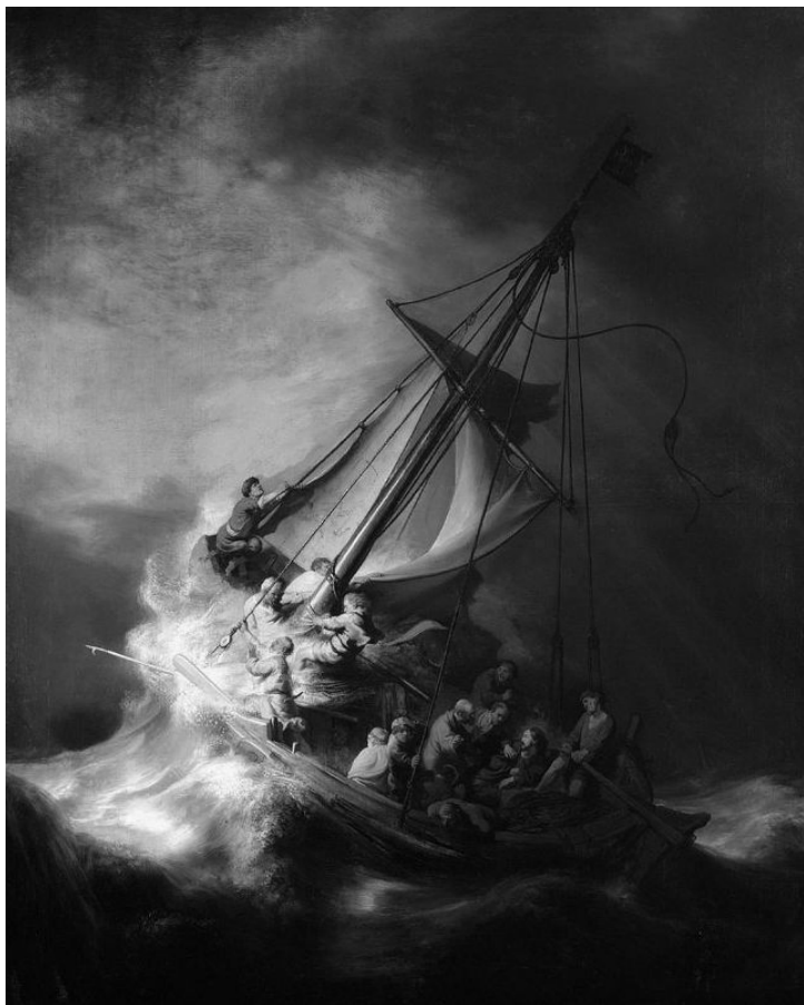
3. „Burza na jeziorze galilejskim”, Rembrandt van Rijn. Obraz skradziony w 1990 roku podczas rabunku muzeum Isabelli Stewart Gardner w Stanach Zjednoczonych.