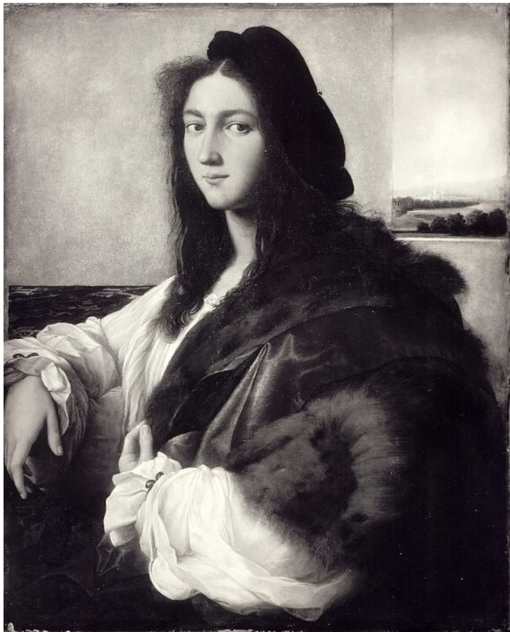
7. „Portret młodzieńca”, Rafael Santi.

W 1939 roku dzieło zostało skonfiskowane przez gestapo z Muzeum Czartoryskich w Krakowie i wywiezione do Berlina.