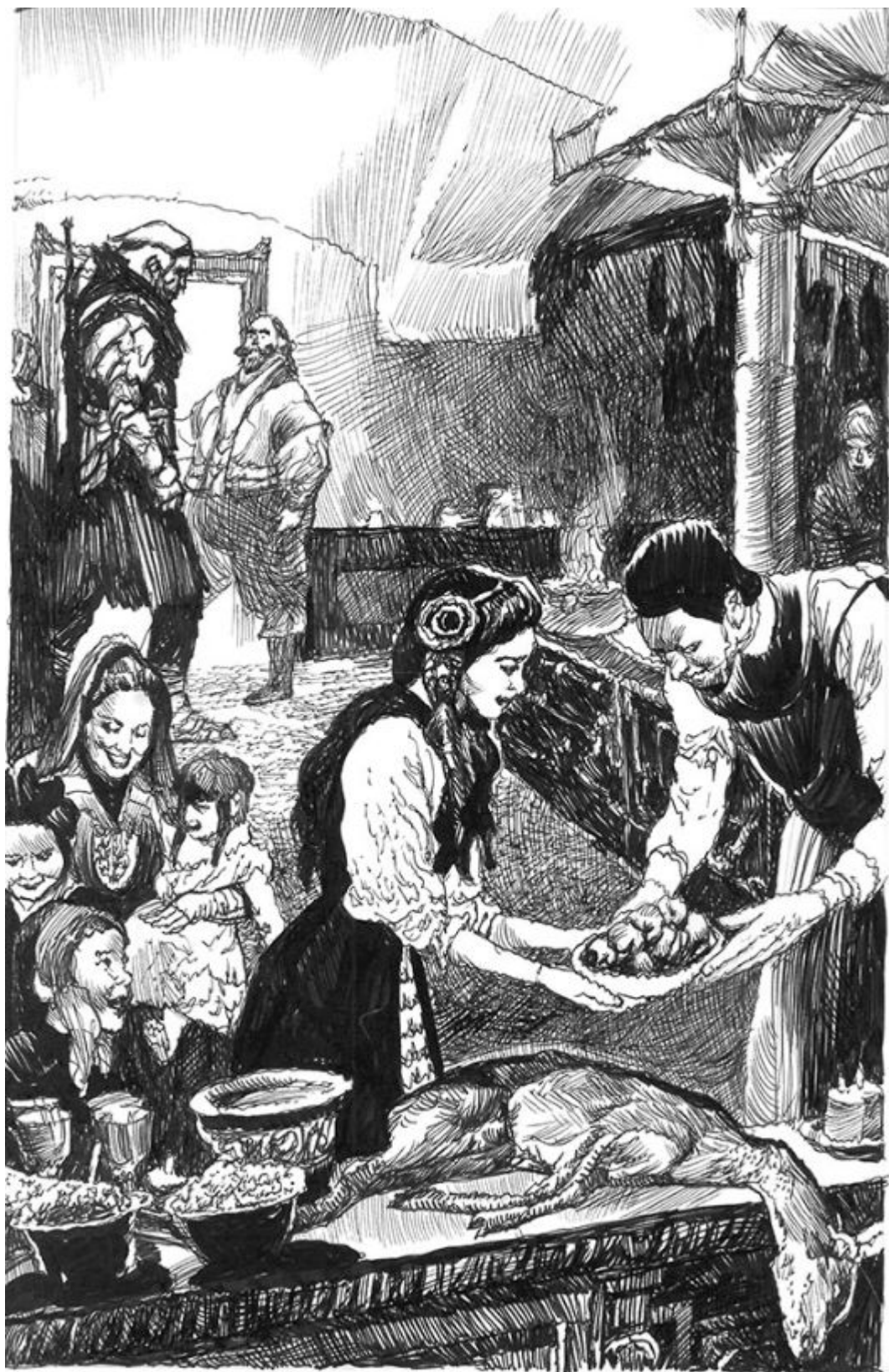
Delen i Glorm zamknęli się w pokoju gospodarza.