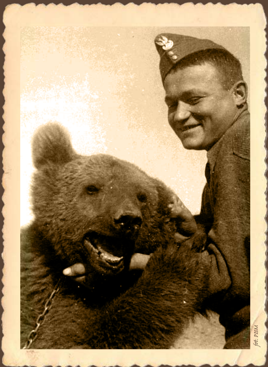
Radosne chwile spędzone na wspólnej zabawie