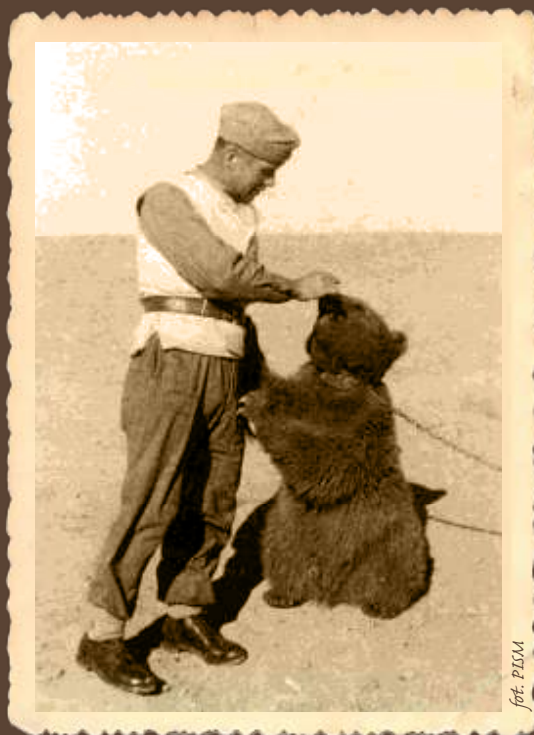
Miś rośnie jak na drożdżach... Nic dziwnego, apetyt mu dopisuje!