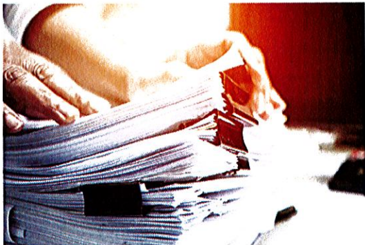
Żądanie wadium leży już tylko w gestii zamawiającego

Znaczne zmiany dotyczą także wadium. Co szczególnie ucieszy wykonawców – nowe p.z.p. ogranicza prawo zamawiających do żądania wadium w postępowaniach uproszczonych (krajowych) wyłącznie do 1,5 proc. wartości zamówienia (wcześniej było to do 3 proc.). W przypadku postępowań unijnych granicą jest 3 proc. wartości zamówienia netto.