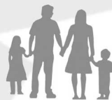
Gospodarstwo 4-5 osobowe