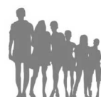
Gospodarstwo 6 i więcej osobowe