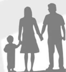
Gospodarstwo 2-3 osobowe