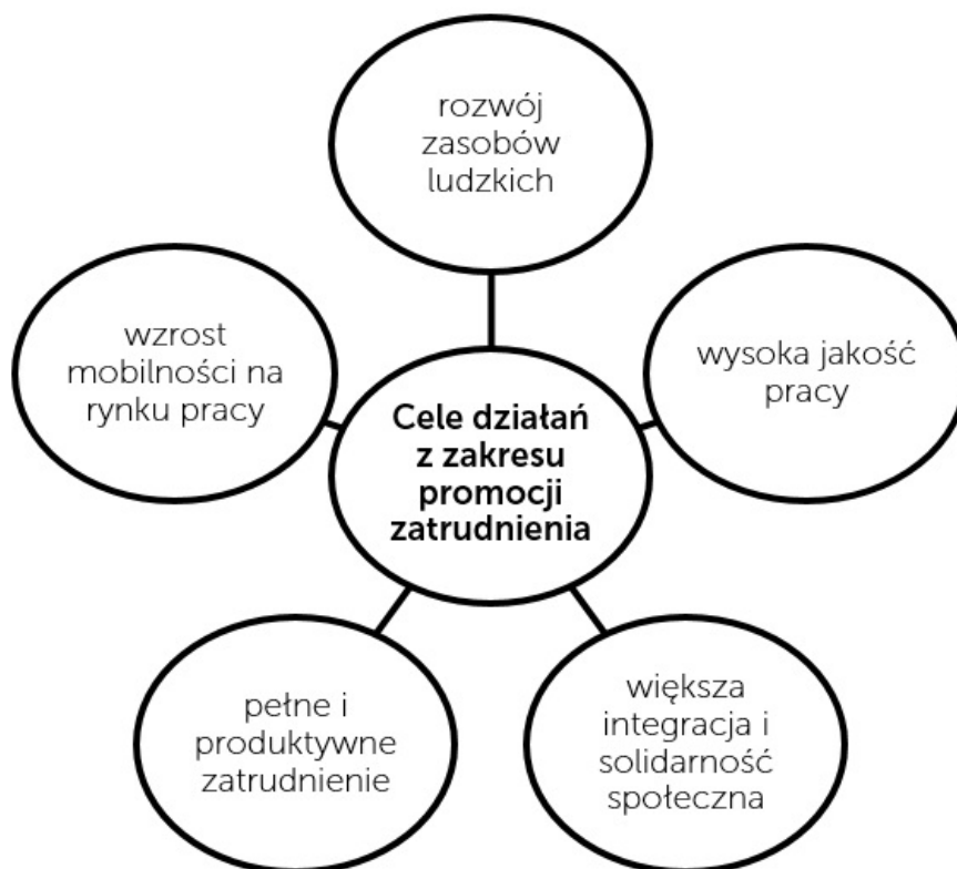
Rysunek 2. Cele działań podejmowanych w ramach ustawy o promocji zatrudnienia i instytucjach rynku pracy