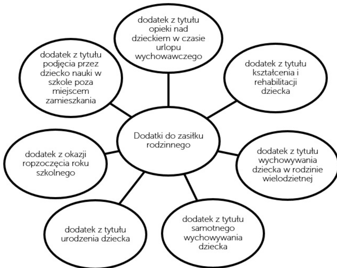
Rysunek 1. Dodatki do zasiłku rodzinnego