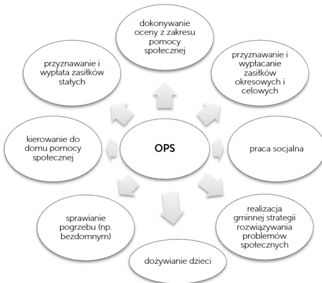
Rysunek 3. Zadania Ośrodków Pomocy Społecznej