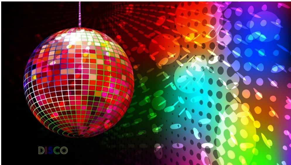
Muzyka disco

Styl disco zwany jest również muzyką dyskotekową . Jest to rodzaj rytmicznej muzyki tanecznej głównie, aczkolwiek nie zawsze, przeznaczonej do tańca w dyskotekach.