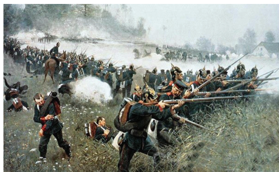
Foto 4. Războiul austro-prusac

De mai multe ori Nicolai Sclifosovschi a participat ca medic la diverse campanii militare. De ex., la cele din perioada războiului austro-prusac în timpul formării (reciclării) sale în străinătate (1866—1868) [5].