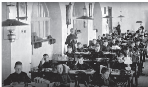
Foto 2. Gimnaziul nr. 2 din Odesa

Acest gimnaziu s-a impus rapid drept una din cele mai importante și prestigioase instituții de învățământ școlar din Odesa grație calității cursului didactic. Din 29 ore de sarcină didactică săptămânală 18 ore erau dedicate studierii limbilor: rusă, latină, greacă, germană și franceză. Celelalte ore reveneau studierii ciclului teoretico-umanitar, unui șir de discipline sociale [13].