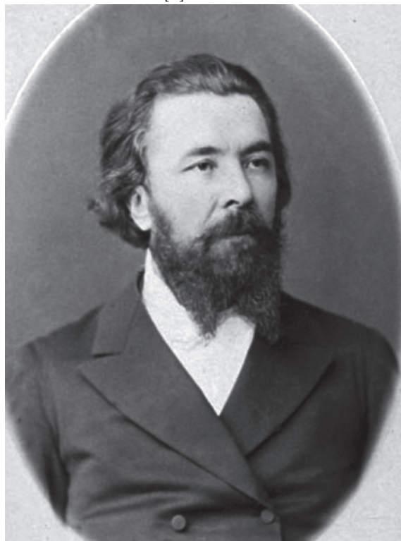
Foto 12. Profesorul Nicolai Sclifosovschi, decan al Facultății de Medicină a Universității Imperiale din Moscova, a.1882

S-a transferat în a.1880 la catedra clinicii chirurgicale de facultate a Facultății de Medicină a Universității Imperiale din Moscova, unde a fost ales Profesor universitar și promovată în funcția de șef, pe care a exercitat-o cu succes [3].