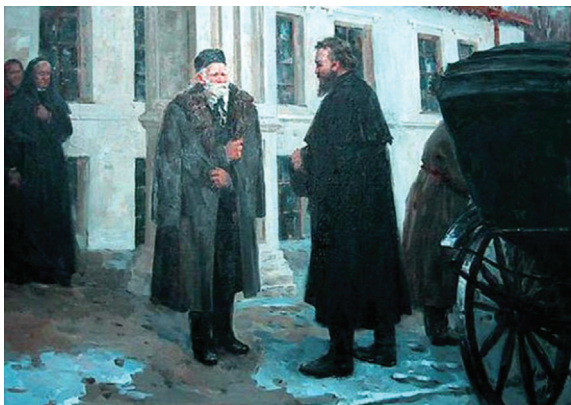
Foto 11. Nicolai Sclifosovschi în vizită la faimosul prieten Nicolai Pirogov

Participarea lui Sclifosovschi la războaiele secolului al XIX-lea l-au format în măsura de a deveni unul din pionierii chirurgiei de campanie și chirurgiei OMF moderne. Grație cercetărilor sale științifice și acțiunilor de popularizare în Rusia au început să folosească antiseptice, să dezinfecteze instrumentele chirurgicale, iar milioane de pacienți au evitat cumpăna septicemiei și altor complicații postoperatorii [15].