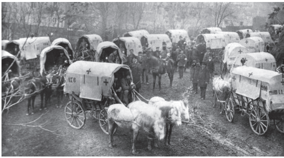
Foto 7. Grup de care sanitare sub Plevna, în războiul ruso-turc 1877—1878

În timpul luptelor sângeroase de lângă Plevna și la poalele muntelui Șipca, căruțele cu răniți soseau la spitalele de campanie una după alta. Nicolai Sclifosovschi se vedea nevoit, uneori, să nu părăsească sala de operație zile la rând, pentru a acorda asistență medicală tuturor celor care aveau nevoie de ea [2,9,12].