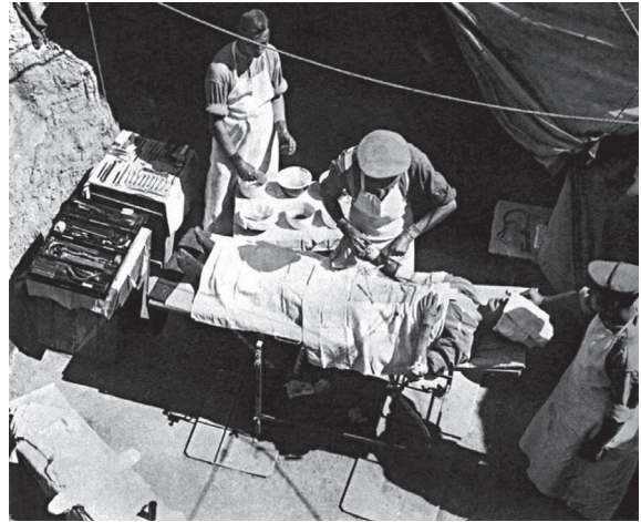
Foto 9. Operațiile se făceau sub focul inamic