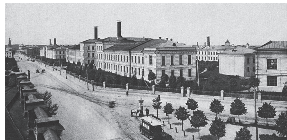
Foto 15. Campusul clinic din Девичье Поле, Moscova

În ritm rapid în vecinătatea clinicii medicale din Девичье поле a fost construit un adevărat orașel, iarăși — cu participarea și sub supravegherea directă, activă a lui Nicolai Scelifosovschi [9].