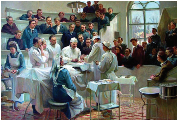
Foto 13. Lecții, prezentate în sala de operații

A fost ales de două ori decan al Facultății de Medicină al Alma Mater .