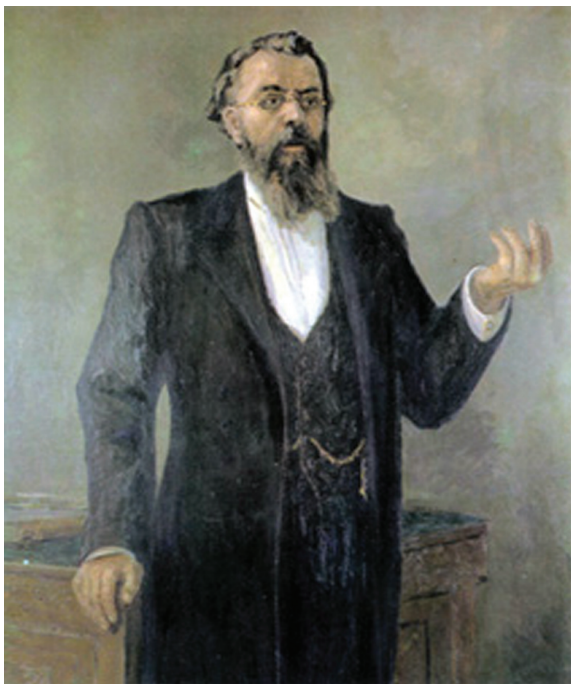
Foto 17. Portretul Profesorului Nicolai Sclifosovschi, făcut la prezentarea unei prelegeri din cursul de chirurgie de facultate pentru medici cursiști ai Institutului Clinic Imperial al Marii Ducese Elena Pavlovna din Sanct-Petersburg, a.1896.

Autoritatea lui Sclifosovschi în lumea medicală de atunci a devenit într-adevăr incontestabilă [2].