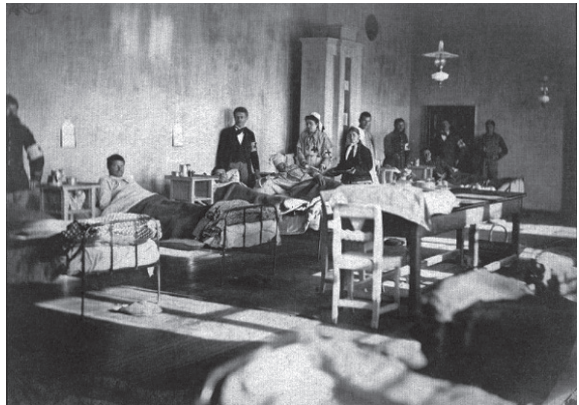
Foto 10. Mulți răniți au supraviețuit doar datorită lui Sclifosovschi. Participanți la luptele războiului ruso-turc într-un spital militar

Mulți dintre cei care au fost răniți, participând la luptele războiului ruso-turc, au supraviețuit doar datorită lui Sclifosovschi. [2] Mai târziu, s-a calculat că în timpul acestor lupte el a operat mai mult de zece mii de răniți [2,9].