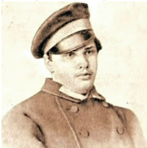
Foto 3. Tânărul Nicolai Sclifosovschi

Sosind la Odesa, a preluat funcția de intern (medic asistent) în serviciul de chirurgie al Spitalului Orășenesc Odesa, iar în curând, grație pregătirii sale, a fost promovat în postul de șef al acestui departament [1,2].