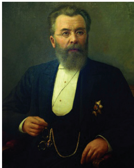
Foto 1. Portretul lui Nicolai Sclifosovski, pictor anonim

Deși muncea cu multă sărguință și responsabilitate (fiind menționat prin înmânarea în a.1843 a unei distincții Pentru activitate infailibilă de 20 ani ) [18], situația familială se înrăutățea cu fiecare an, iar banii câștigați nefiind suficienți nici pentru strictul necesar [2]. Visul de a deveni medic a apărut la Nicolai Sclifosovski din fragedă copilărie. Asupra lui au influențat povestirile mamei și fraților mai mari relativ