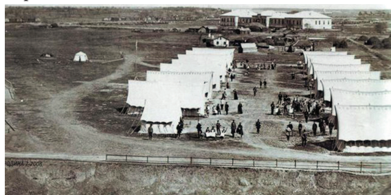
Foto 5. Spital militar de campanie rusească de triere și amplasare a răniților în perioada războiului ruso-turc 1877—1878. România

A fost implicat în calitate de chirurg șef al armatei ruse în războiul ruso-turc (aa.1877—1878), izbucnit după revoltele din Balcani [2,5,8].