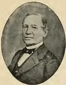
Dr. J. Mianowski Rektor Szkoły Głównej.

metropolitę warszawskiego. W maju 1862 ogłoszona nowa ustawa o wychowaniu publicznem: urządzone na nowych zasadach szkoły początkowe, powiatowe (realne), gimnazyja, Instytut Maryjski przeniesiony