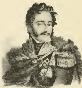
Józef ks. Poniąowski Minister wojny.

Zaprowadzone w Warszawie krótkie rządy wojskowe arcyksięcia Ferdynanda w imieniu cesarza Franciszka I. Rząd Księstwa z armią warszawską, pod dowództwem