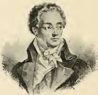
Stanisław Potocki Minister Ośw. Publ. i Wyzn. Rel.

oświecenia publicznego i wyznań religijnych — Stanisław Potocki, po nim Stanisław Grabowski; sprawiedliwości — Wawrzecki, po nim Walenty Sobolewski, Marcin Badeni, Ignacy Sobolewski; spraw