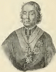
Jan Paweł Woronicz Prymas Arcybiskup Warszawski.

pozostała nieobsadzoną. Wszystkich dziewięciu biskupów zasiadało w Senacie. Żydzi nie wykonywali praw politycznych. W 1816 założony w Warszawie uniwersytet Królewsko-Aleksandryjski w pięciu