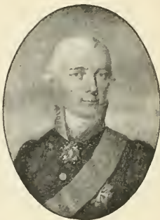
Tomasz Ostrowski Prezes Senatu.

Ostrowskiego w Senacie, Stanisława Sołtyka w Izbie poselskiej, w grudniu 1811: wyrażone żale opozycyi na ciężki' stan gospodarczy i finansowy, uchwalone je-