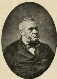
Aleksander Wielopolski Naczelnik Rządu Cywilnego.

doradczych Aleksandra margrabiego Wielopolskiego, podjęto próbę przekształceń zasadniczych w organizacyi kraju w duchu autonomicznym pierwotnych intencji Sta-