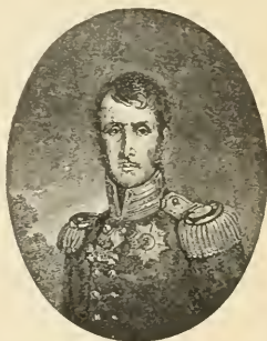
Fryderyk Wilhelm III.

osobiście do Warszawy, raz wnet po wstąpieniu na tron, powtórnie właśnie latem 1801 dla odebrania hołdu i poznania kraju. Kraj ten podzielony został na dwa wiel-