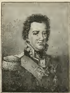
Henryk Dąbrowski General Jazdy, Senator Wojewoda.

Prusakom, rektyfikacyi granicznej obok Wieliczki, przyznanej Austryi, i Krakowa z obwodem, uczynionego miastem wolnem, — utworzone zostało w dzisiejszych