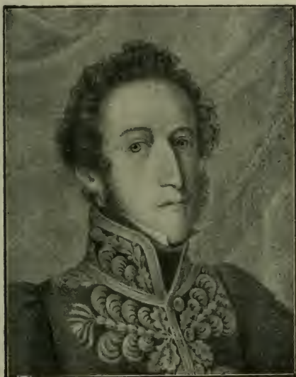
August Longin książę Lobkowitz gubernator Galicyi od r. 1826 do 1832.

malną ekspedycję wojskową w celu poszukiwania broni i dział Dwernickiego, zakopanych rzekomo wśród ruin zamku Kudrynieckiego. Wysłano do Kudryniec pod komendą oficerów