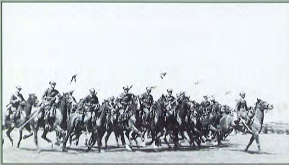
Święto 3 maja 1936 r. - blonia krakowskie - 8 pułk ułanów