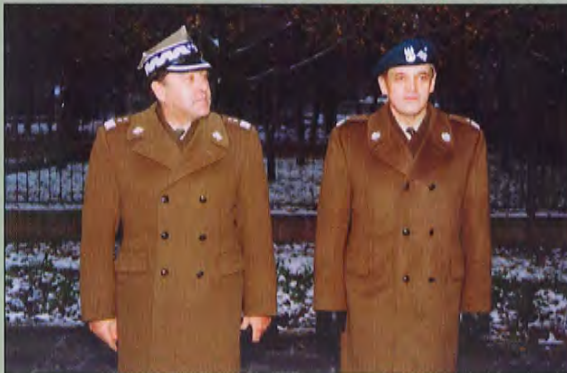
Dowódca KOW gen. dyw. ZENON BRYK i Szef Sztabu KOW gen. bryg. ZDZISŁAW WIJAS