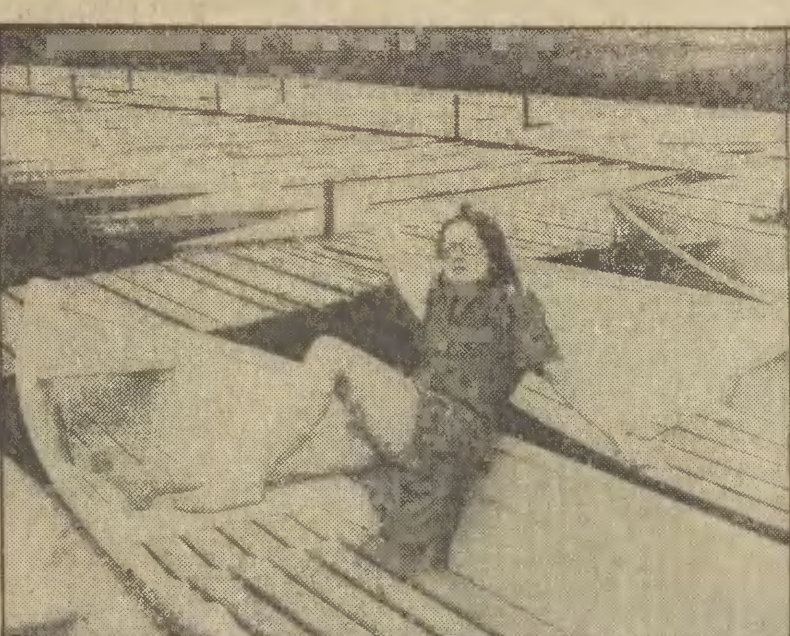
Czeka las, czeka rzeka i przygotowany sprzęt, a tam ciągle nie ma nas. Ale niech tylko przygrzeje słońce...

Największy od 35 lat pożar w USA * W centrum rozrywkowym zginęło 159 osób