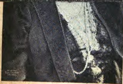
Holenderska królowa-matka Emma.

14. w Fryde r. 8. kwie Alexandrow 1843). lut. 1797, ne al-pulko- dyi pieszej,