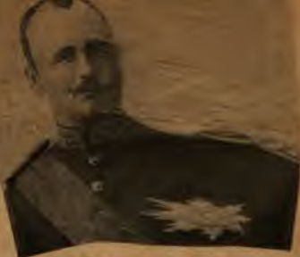
Kronprinz Friedrich August geb. am 25. Mai 1865.