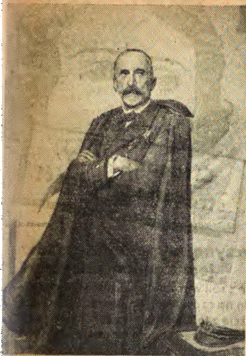
Arcyksiążę Karol Stefan w mundurze admirała floty austriackiej (portret malowany przez Kazimierza Pochwańskiego w roku 1927).

Synowie: 1) Ascyks. Leopold Lucyszek, ur. 6 czerwca 1823, generał