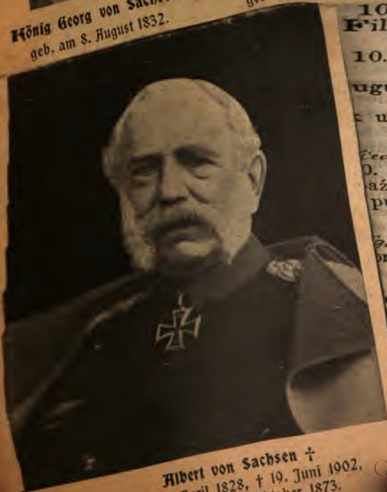
Albert von Sachsen † geb. 23. April 1828, † 19. Juni 1902, regierte seit 29. Oktober 1873.