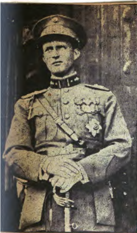
Król belgijski Leopold III.