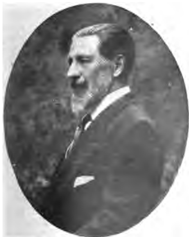
Ks. Filip Orleański zmarł w Palermo dn. 28 marca r. 1844.

Ks. Maryę - Teresę Beatrykę ur. 14. lipca 1817. Arcyksiężniczkę austryacką - Este, córkę Franciszka IV. księcia Modenckiego. [Erohnadorf w Niższej Austrii].