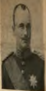
König Georg von Sachsen geb. am 8. August 1832.