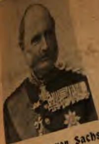
König Georg von Sachsen geb. am 8. August 1832.