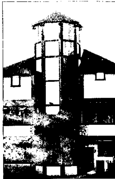
Wieża Instytutu Monroe'a

Munroe Fields W pobliżu Inverness, Szkocja, zbudowana w 1151 A.D. przez Roberta Monroe i jego ojca.