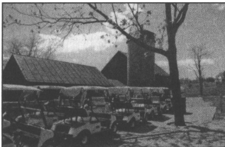
Country Club znajdujący się w miejscu, gdzie kiedyś była farma Dodda