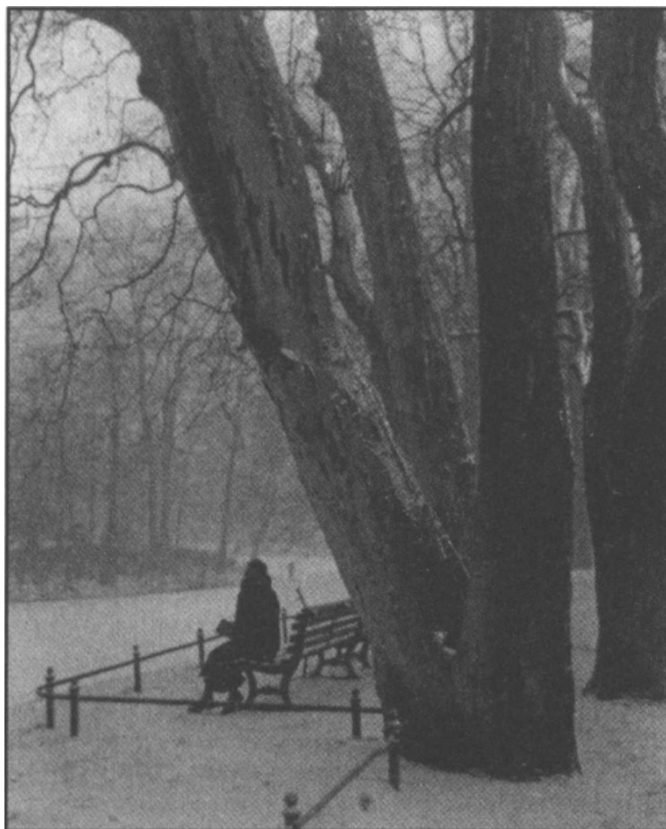
Tiergarten, styczeń 1934 roku