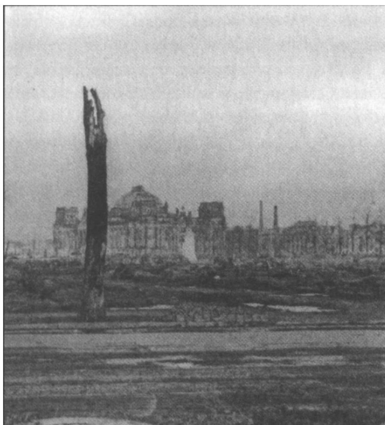
Tiergarten po rosyjskiej ofensywie, w tle budynek Reichstagu