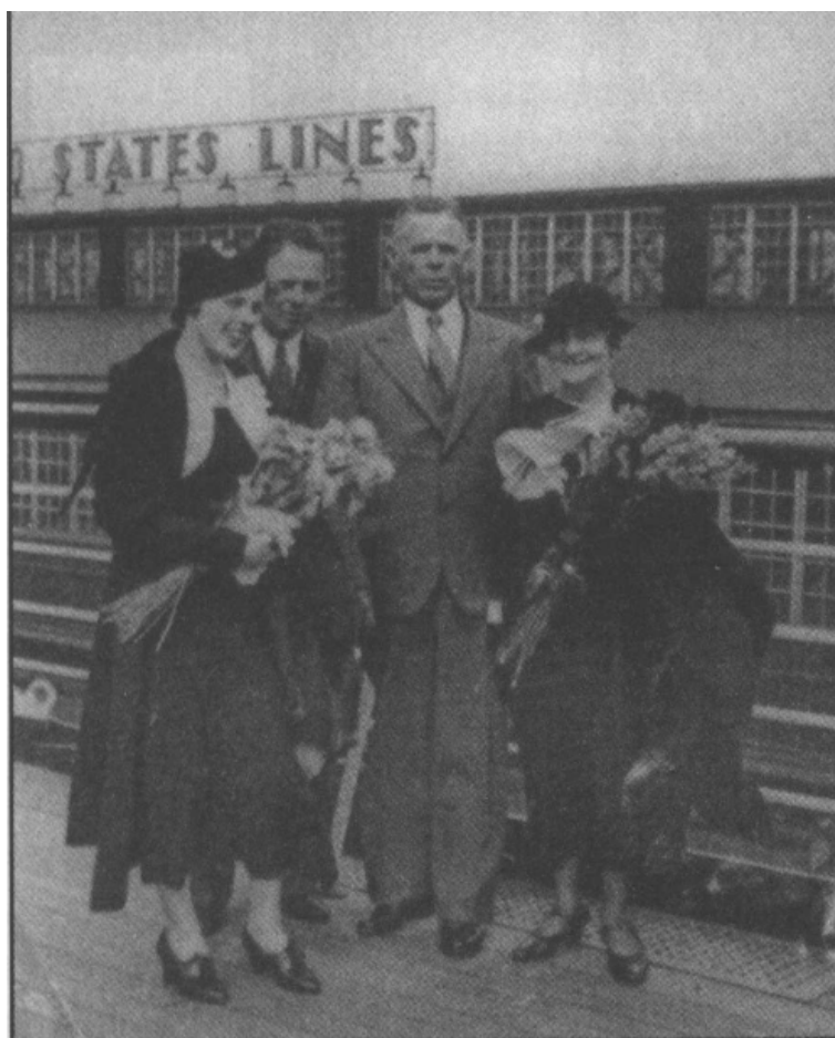
Doddowie przybywają do Hamburga