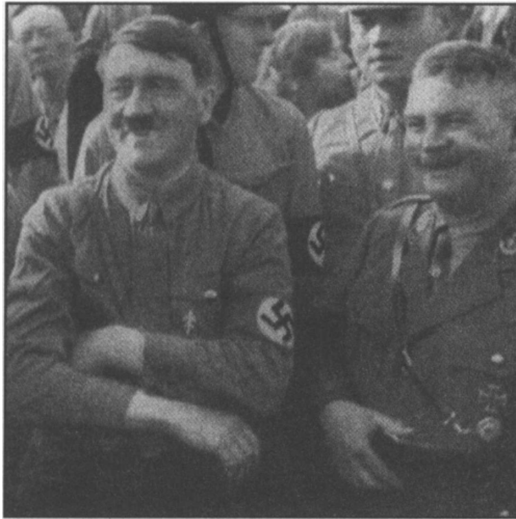
Hitler i Röhm