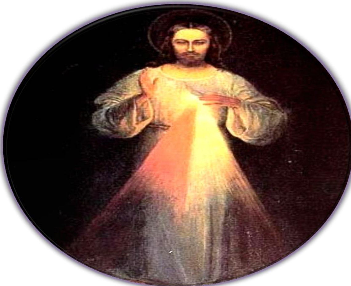
OBRAZ JEZUSA MIŁOSIERNEGO PĘDZLA EUGENIUSZ KAZIMIROWSKIEGO