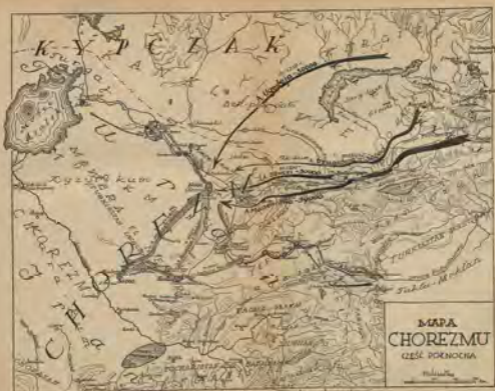
MAPA CHOREZMU CZĘŚĆ PÓRNOCHA

→ → → → → Kanały wodociągowe ○ ○ ○ ○ ○ Jeziora i jeziorzyska