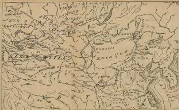
MAPA MONGOLJI I PAŃSTW OSCIENNYCH