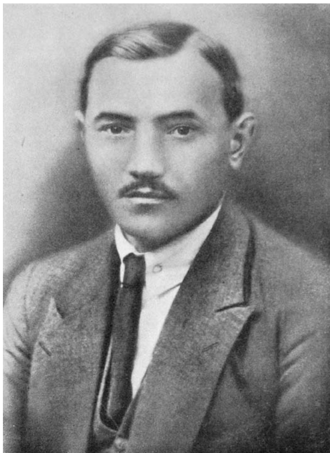
Bolesław Bierut. Zdjęcie z 1924 roku