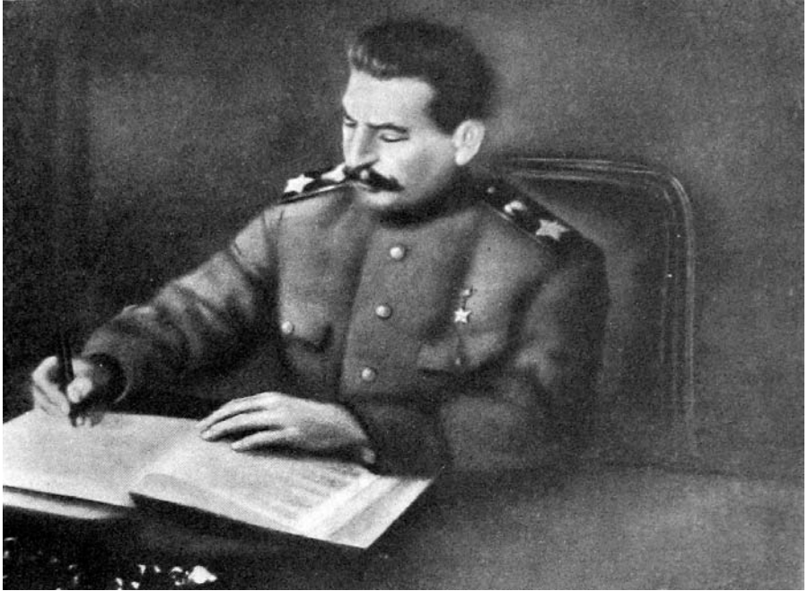
Generalissimus Józef Stalin podpisuje pakt polsko-radziecki 21 kwietnia 1945 roku