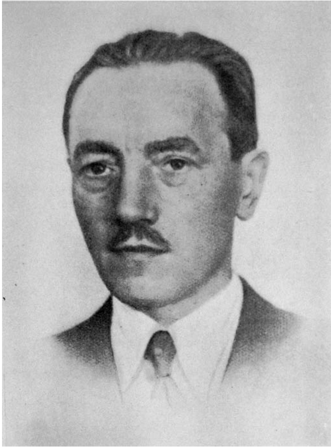
Bolesław Bierut w latach okupacji hitlerowskiej