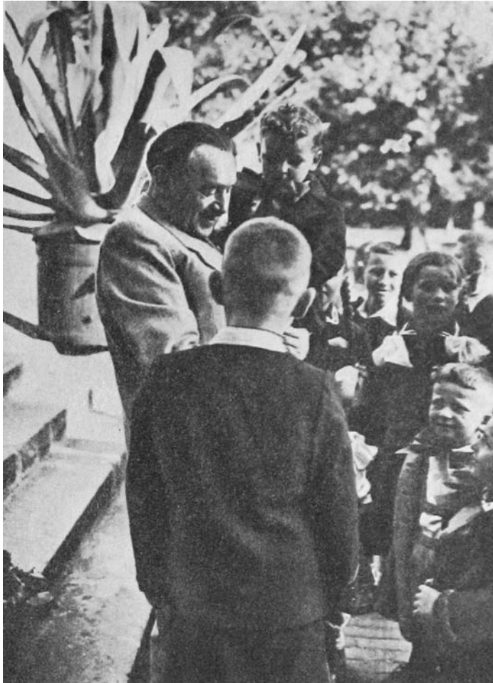
Dzieci z wizytą u Prezydenta w Belwederze