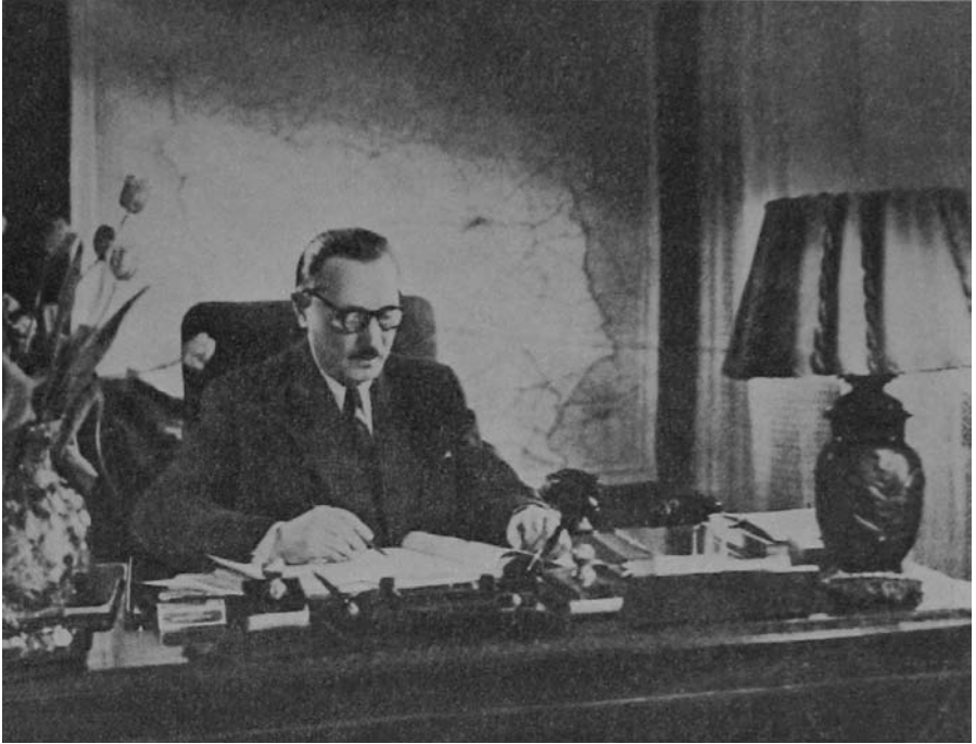
Bolesław Bierut w Belwederze przy pracy