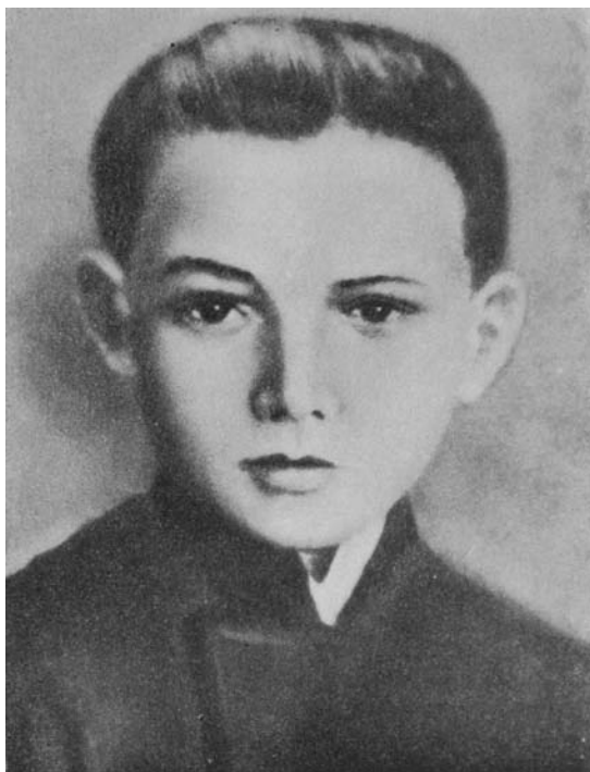
Bolesław Bierut w 1905 roku