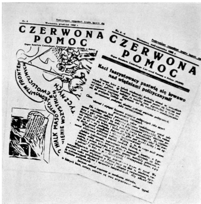
Organ KC MOPR w Polsce „Czerwona Pomoc”