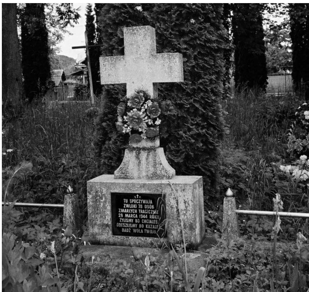
Krzyż na zbiorowej mogile ofiar banderowców na cmentarzu w Kosowie Huculskim. Ogółem w tej miejscowości w dwóch nocnych napadach z 29 na 30 marca i z 22 na 23 kwietnia 1944 r. zamordowano ponad 100 Polaków.

Przyjmując – na podstawie analizy wykorzystanego dotąd materiału badawczego – że nie możliwe było ustalenie całości strat ludności polskiej w Małopolsce Wschodniej, podobnie jak już opisano to odnośnie do Wołynia, wykazane liczby ofiar zostały powiększone o szacunkowe straty, co jest uwidocznione w tabeli. Prawdopodobna liczba zamordowanych Polaków w Małopolsce wynosi 70 800.