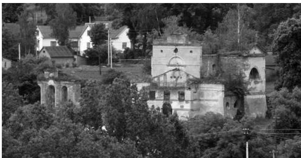
Ruiny spalonego przez UPA w lutym 1944 r. kościoła pw. św. Stanisława Biskupa Męczennika z 1756 r. we wsi Wiśniowiec Stary w gm. Wiśniowiec, pow. krzemienieckiego (woj. wołyńskie). W kościele zostało zamordowanych i spalonych kilkudziesięciu Polaków.