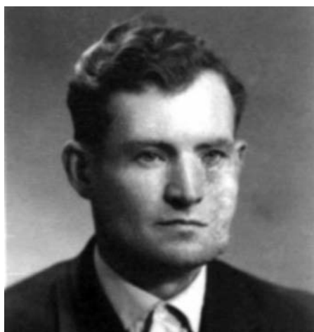
Ranny podczas rzezi kol. Stasin w pow. włodzimierskim na Wołyniu w lipcu 1943 r. Lewa część twarzy zniekształcona na skutek obrażeń