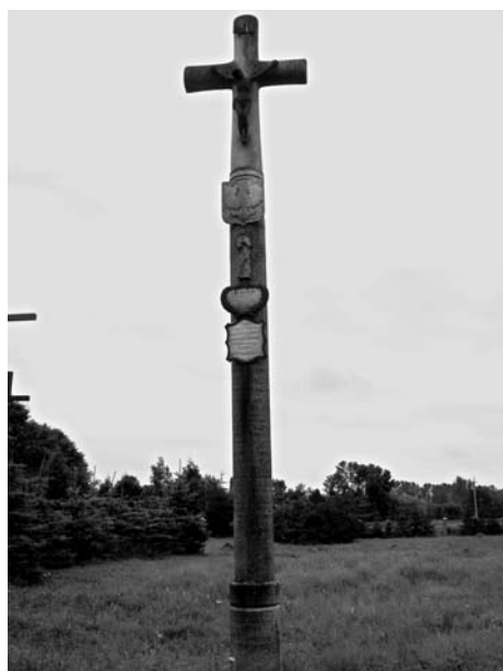
Pierwszy krzyż w hołdzie ofiarom UPA postawiony na cmentarzu w Porycku przez ocalonego z mordu w kościele Stanisława Filipowicza przy współpracy lokalnych władz ukraińskich. Napis na krzyżu w języku polskim i ukraińskim: „Tragedia między Polakami i Ukraińcami w XX wieku. Porzucimy niepamięć”.