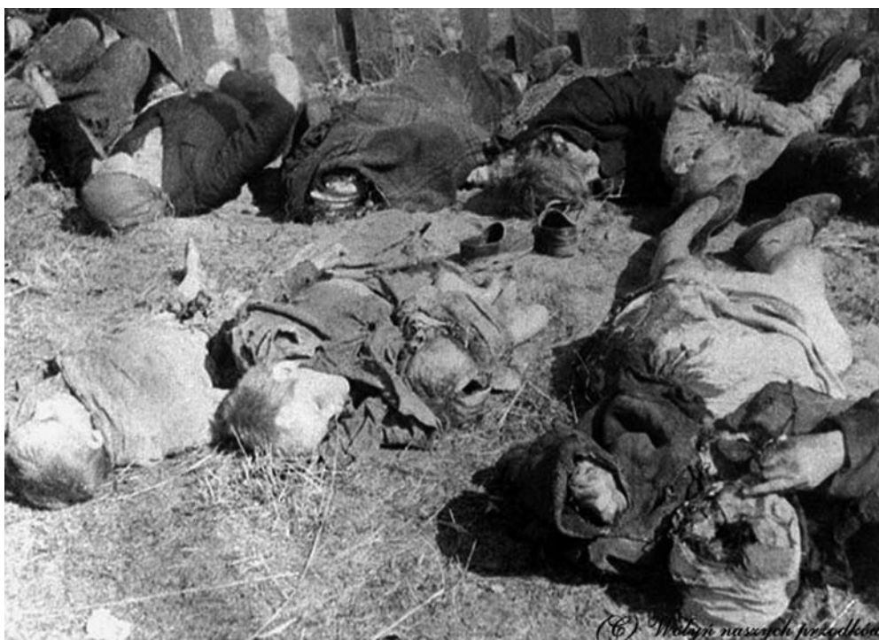
Pomordowani przez UPA w kol. Lipniki w pow. kostopolskim na Wołyniu, marzec 1943