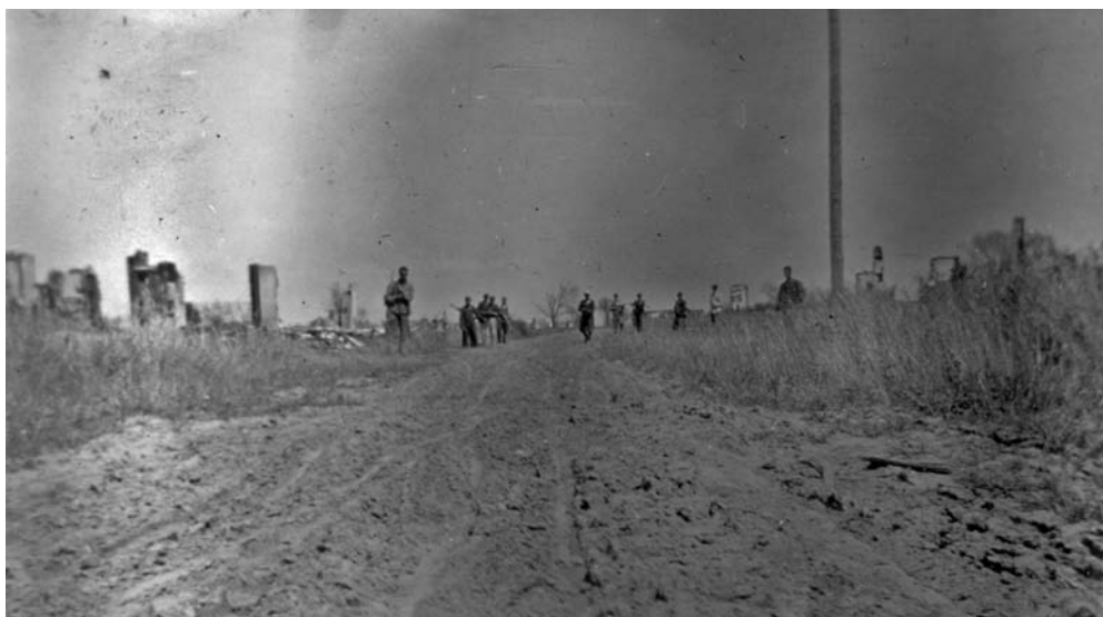
Po napadzie UPA na kol. Taraż w pow. łuckim na Wołyniu, gdzie zamordowano 20 osób; na tle zgliszcz bezsilni obrońcy, fot. Tadeusz Wolak, obrońca Taraża i żołnierz 27 Wołyńskiej Dywizji Piechoty AK