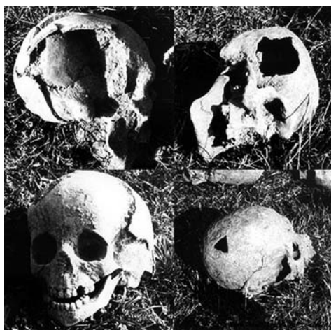
Zdruzgotane przez maczugi, młotki do zabijania zwierząt i obuchy siekier czaszki ekshumowanych ofiar zagłady wsi Wola Ostrowiecka w pow. lubomelskim na Wołyniu w sierpniu 1943 r.