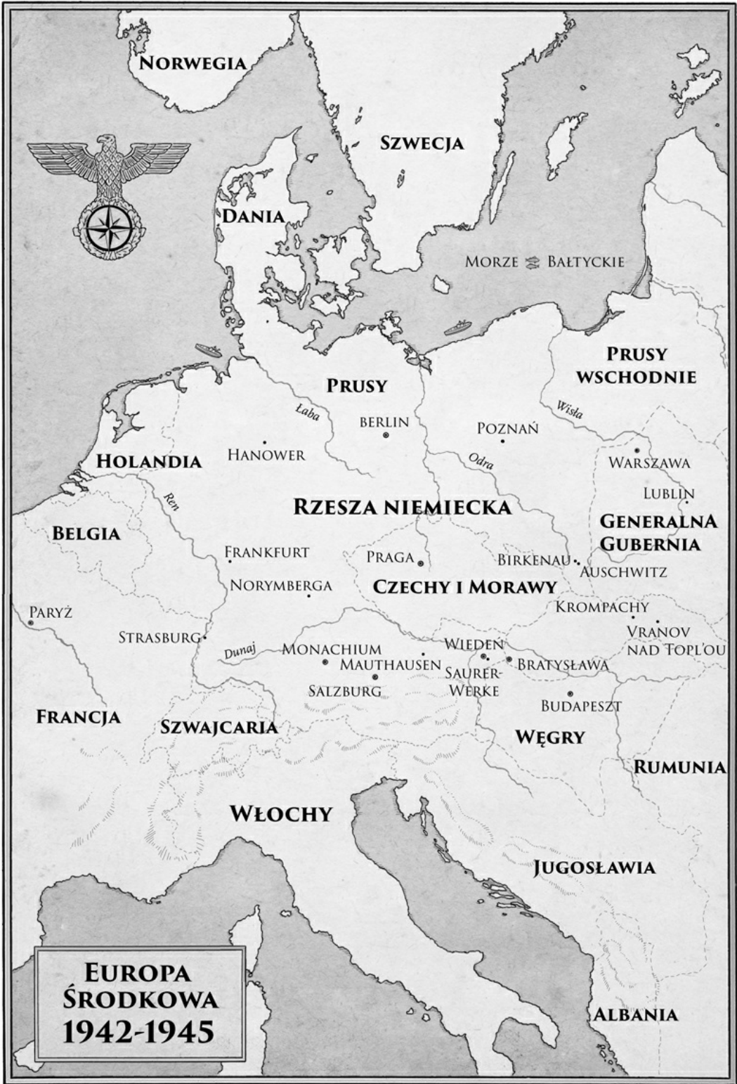
EUROPA ŚRODKOWA 1942-1945