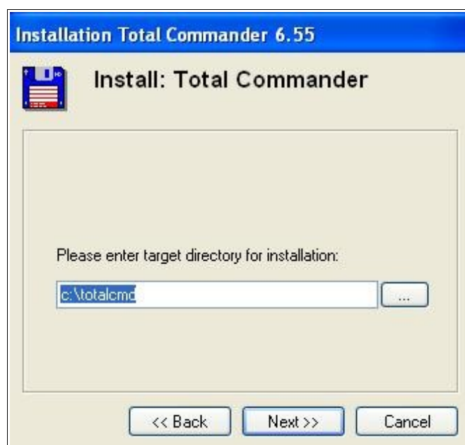
Rysunek 2. Ścieżka do instalacji programu.

W kolejnym kroku instalator zapyta nas gdzie chcemy zainstalować program. Domyślnie jest to c:\totalcmd. Po wybraniu ścieżki instalacji programu klikamy w następnych krokach na „Next”. Po zakończeniu instalacji program jest gotowy do użycia.