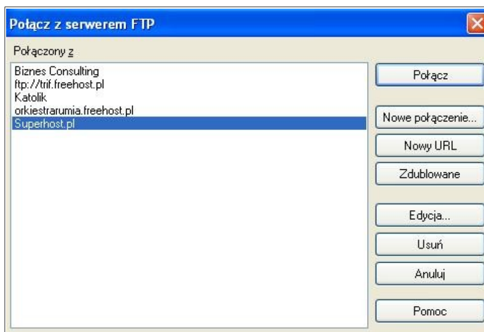
Rysunek 3. Konfiguracja połączenia.

Następnie wybieramy przycisk „Nowe połączenie”.