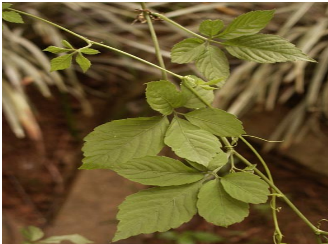
Rys 4. Gynostemma pentaphyllum

Gynostemma (łac. Gynostemma pentaphyllum ) występuje w Chinach, Korei, Japonii i południowo-wschodniej Azji. Jest wieloletnim, liściastym, pnącym ziołem. W ramach tego gatunku istnieje 13 odmian. Wszystkie występują w Azji. W Chinach rośnie 11 odmian, z czego 7 rośnie tylko w Chinach i to właśnie one posiadają zasoby dzikiej Gynostemmy pentaphyllum . Rośnie na dużym obszarze gór Qin Ling i w 15 prowincjach na południe od Jangcy. Uważa się, że najwyższej jakości Gynostemma pochodzi z brzegów rzeki Jangcy (z Regionu Changjiang Gorge), z regionu Shen Nong Jia, z Wu Shan oraz z Xing Dou Shan.