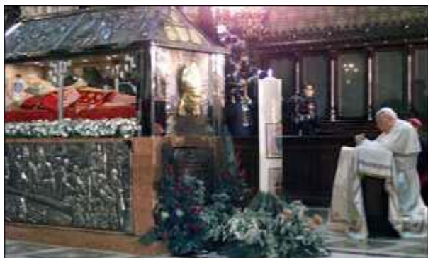
Jan Paweł II klęczy przed mauzoleum Stepinaca w Chorwacji