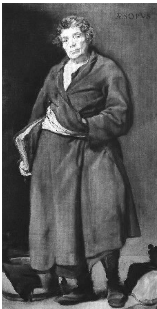
Diego Velazquez, "Ezop", 1639-1640