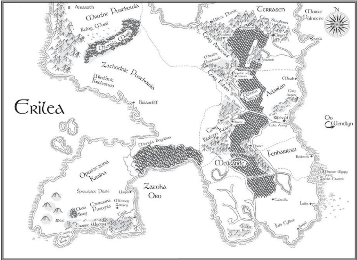
Map © Kelly de Groot