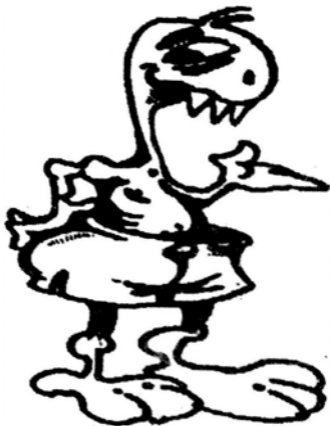
Gad w zalotach