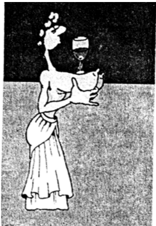
Grecy na tackach