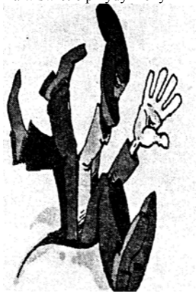
Cud w Lipsku