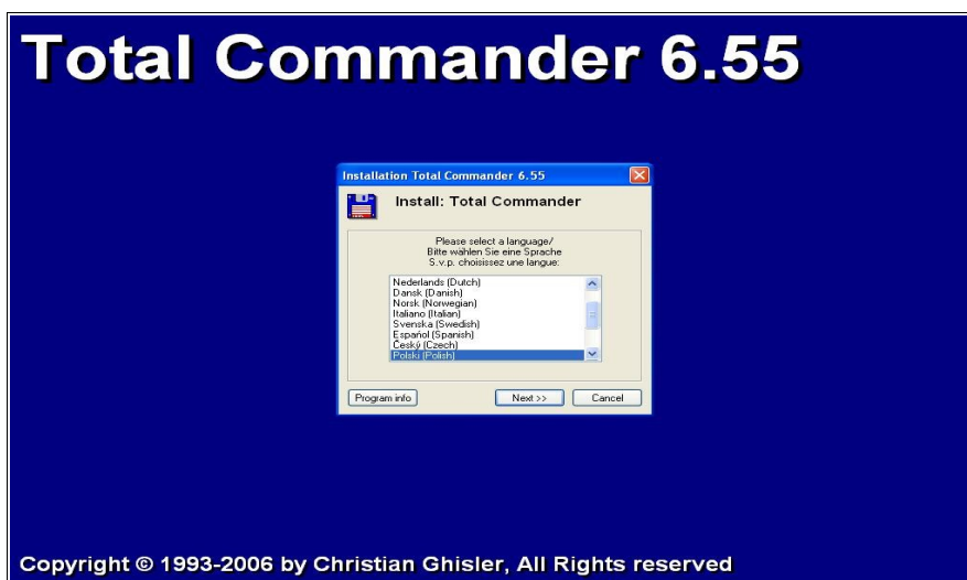
Rysunek 1. Okno powitalne instalatora Total Commander'a

Na początek ściągamy plik instalacyjny ze strony producenta, a następnie go uruchamiamy. Plik jest mały, tak więc nie powinno być problemów ze ściągnięciem go z Internetu (zajmuje około 1,6 MB).