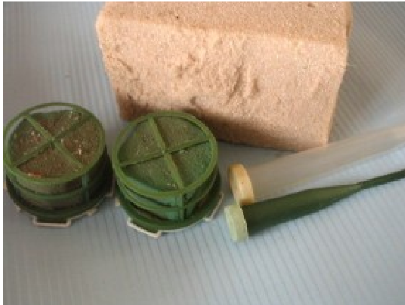
Gąbki oraz fiolki (można w nich umieścić kwiaty).

Niektóre kwiaty są bardziej delikatne, a przez to trudniejsze w układaniu. Jeśli chcemy ułożyć na gąbce kompozycję z kwiatów o miękkich łodygach, to należy usztywnić ich łodygi. Wystarczy przymocować do łodygi, za pomocą taśmy samoprzylepnej, dwa cienkie drewnianki: