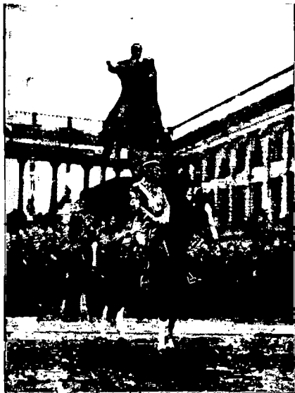
JÓZEF PIŁSUDSKI podczas rewji w dniu 11. listopada 1926 r.