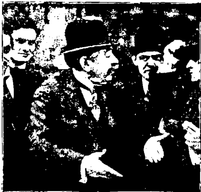
Aiistlde Briand wSrócl dziennikarzy