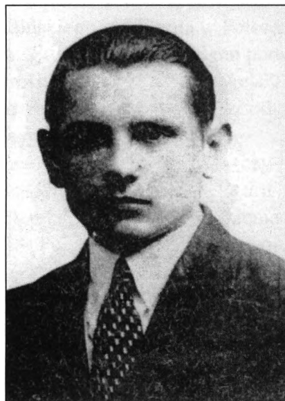
Ołeksza Hasyn „Łycar” (1907–1949) szef sztabu UPA (od 1945 r.)