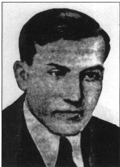
Iwan Kłymyw „Jewhen Łehenda” (1909–1942) referent wojskowy OUN