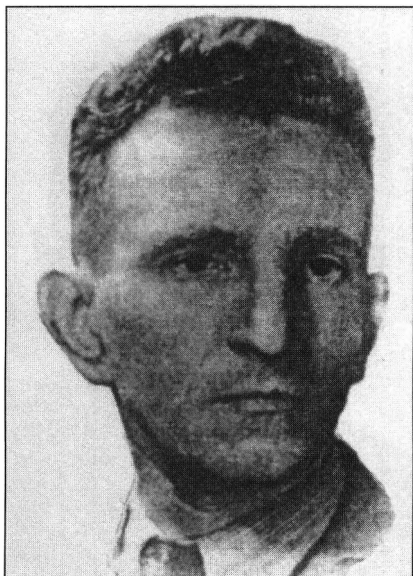
Roman Szuchewycz „Taras Czuprynka” (1907–1950) główny dowódca UPA