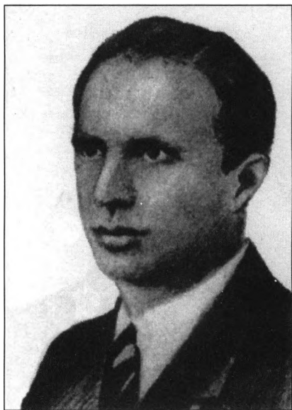
Wasyl Sydor „Szełest” (1910–1949) dowódca UPA-Zachód (Galicja Wschodnia)