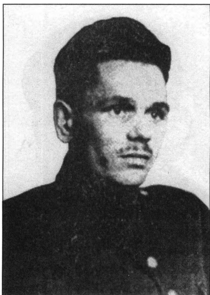
Iwan Łytwyńczuk „Dubowyj” (1917–1952) dowódca UPA-Północ (od 1945 r.)