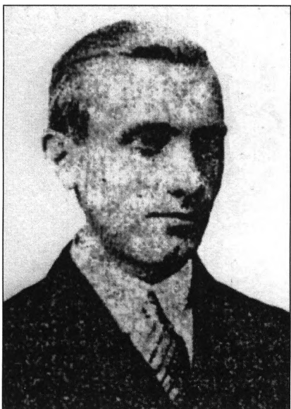
Dmytro Kljaczkiwskyj „Kłym Sawur” (1911–1945) dowódca UPA-Północ (Wołyń)