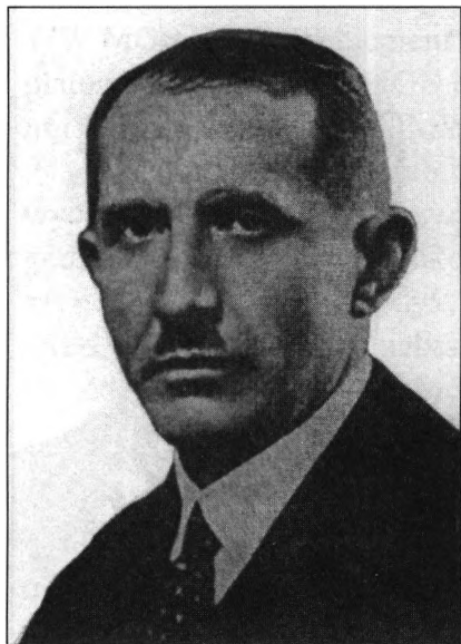
Jewhen Konowalec (1891–1938) prowidnyk UWO i OUN