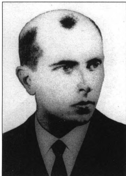
Stepan Bandera (1909–1959) prowidnyk OUN-B