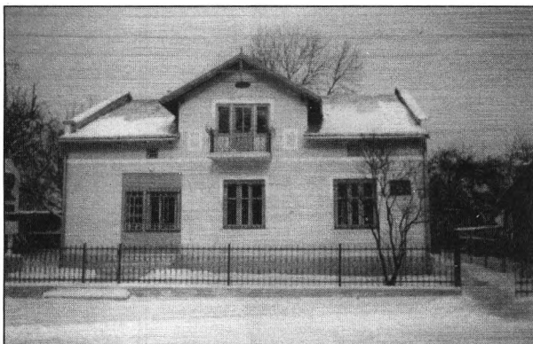
Dom w Biłohoroszczy, w którym znajdowała się ostatnia kryjówka d-cy UPA R. Szuchewycza