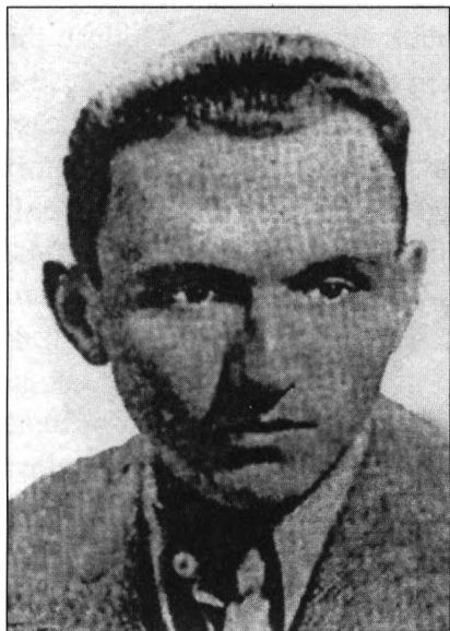
Wasyl Kuk „Łemisiz” (1913) ostatni dowódca UPA