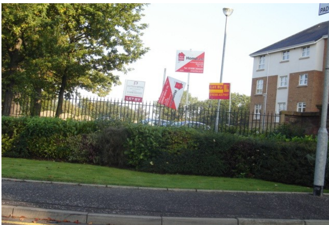
Fot. Tablice informacyjne agencji

Agencje najmu bardzo często reklamują się tablicami informacyjnymi umieszczanymi przed lokalem, który posiadają do wynajęcia.